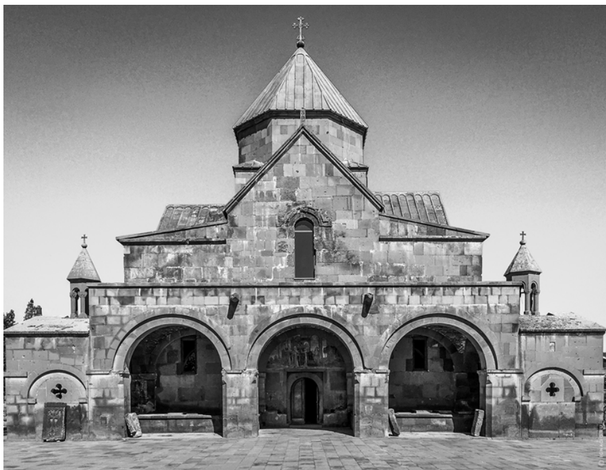
Рис. 2. Церковь Святой Гаяне, расположенная в городе Вагаршапат (Армавирская область, Армения)

Одним из главных факторов, которые определяют фундаментальные принципы построения планировочных структур храмовой архитектуры, принято считать их функциональное значение. Национальная храмовая архитектура Армении имеет