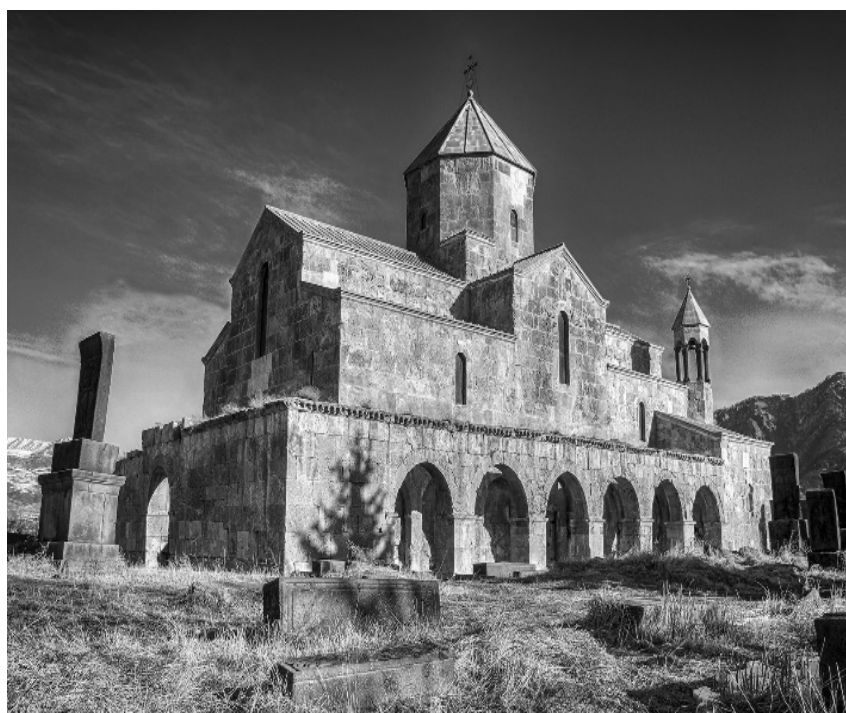
Рис. 1. Монастырь Одзун, расположенный в селе Одзун Лорийской области Армении

В середине IX века, когда в Армении начали применять новый строительный материал – так называемые туфовые плиты, – постройки стали более утонченными. Вследствие данного фактора происходит трансформация сферического контура кровли, стандартная черепичная кровля теперь заменяется на коническую. В промежутке X–XI вв. происходит распространение парусных конструкций, которые стали наиболее часто применяться в храмовой архитектуре Армении [5]. Теперь привычная граненая форма барабанов и куполов заменяется на круглую форму. При этом следует отметить, что купола зачастую визуальнo увенчиваются за счет покрытия зонтичной формой, которая в свою очередь является одной из особенностей в пространственно-композиционном построении национальной храмовой архитектуры. Примерно с X в. в разных уголках Армении постепенно начинают и развивают строительство главных архитектурных ансамблей. На протяжении всей армянской культуры возведение монастырских комплексов занимает особое место, особенно явно это прочитывается на рубеже XI–XII вв., так как именно в это время происходит наиболее активное возведение исторически значимых церквей и монастырей на территории Армянского нагорья. И большая их