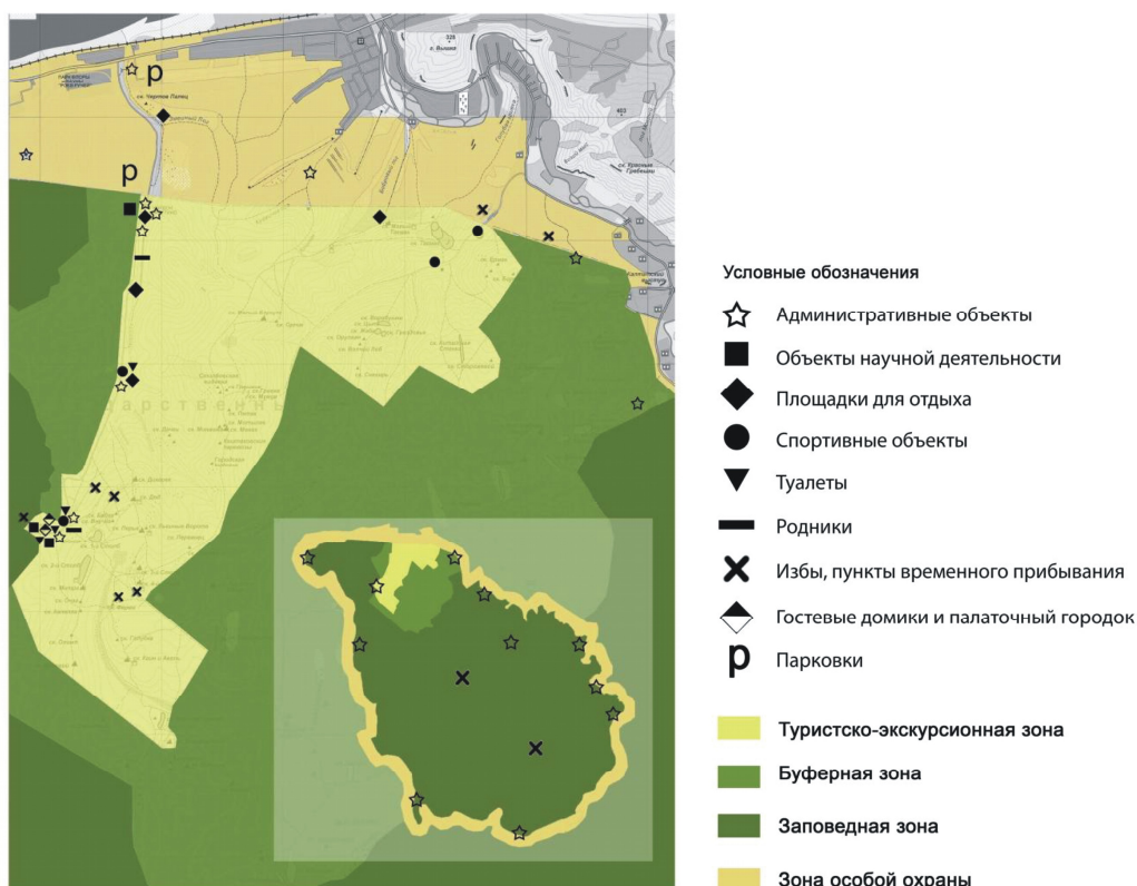
Рис. 1. Схема существующего территориального зонирования ООПТ «Столбы» с обозначением инфраструктуры объекта (авторы: А.Д. Чистякова, Е.Д. Шестакова)

4. Буферная зона – переходная зона от туристско-экскурсионного района к зоне строгой заповедности; составляет 9 % от общей площади ООПТ «Столбы». Основное назначение: предот-