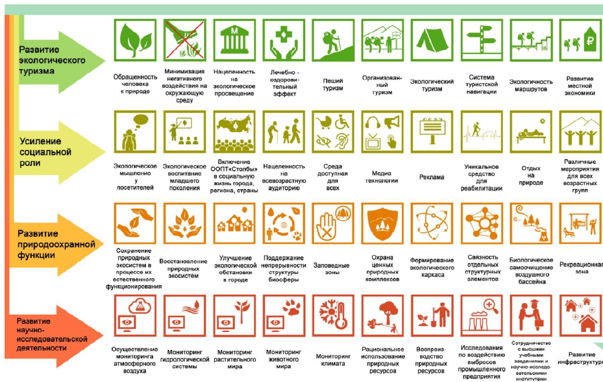
Рис. 4. Основные векторы развития ООПТ «Столбы» как национального парка (предложение А.Д. Чистяковой) [3]

Немаловажным является и совокупный доход от туристской деятельности, который из расчета на одного туриста повышается с каждым годом в национальных парках по сравнению с заповедниками [13]. В структуру доходов от экологического туризма входят плата за вход, размещение, органи-