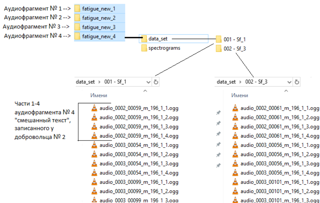
Рис. 3. Структура выгружаемых комплексом данных

Для автоматизации процесса формирования датасетов в настоящей работе использовался web-сервис для доступа к базе данных (рис. 1, пункт меню «Export»). Пример результата «выгрузки» данных из БРД представлен на рис. 3.