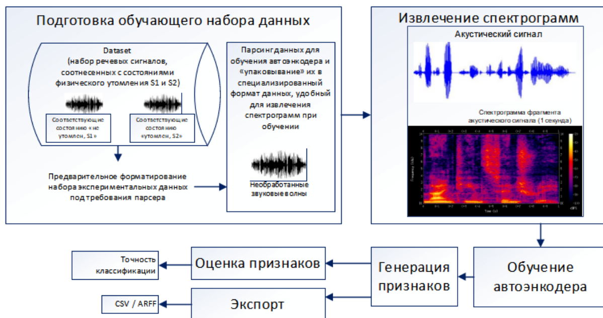
Рис. 2. Этапы использования библиотеки auDeep [9]

Для автоматизации процесса формирования датасетов в настоящей работе использовался web-сервис для доступа к базе данных (рис. 1, пункт меню «Export»). Пример результата «выгрузки» данных из БРД представлен на рис. 3.