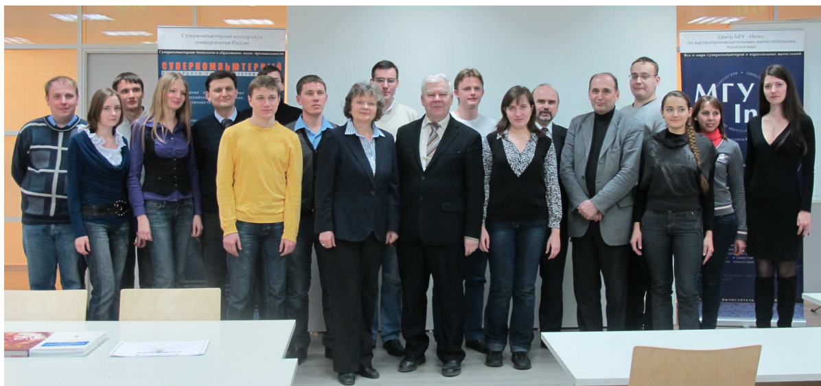
Рис. 3. Группа повышения квалификации в НОЦ «СКТ-Центр»

За время выполнения проекта успешно реализованы программы переподготовки и повышения квалификации профессорско-преподавательского состава. Успешно прошли переподготовку и повышение квалификации преподаватели из более 40 вузов всех федеральных округов России.