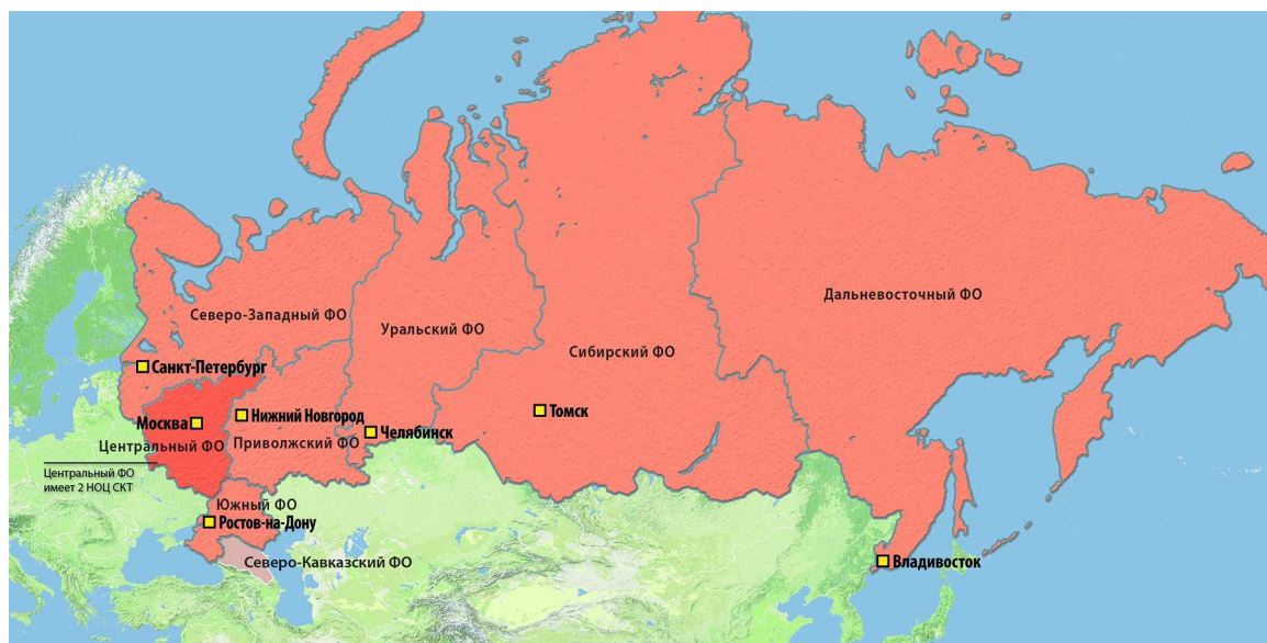
Рис. 1. География Системы научно-образовательных центров суперкомпьютерных технологий

В результате выполнения проекта «Суперкомпьютерное образование» Комиссии при Президенте РФ по модернизации и технологическому развитию экономики России к концу 2012 года реализована национальная Система научно-образовательных центров суперкомпьютерных технологий. В Систему НОЦ СКТ входят 8 региональных НОЦ, созданных в 7 федеральных округах России (рис. 1).