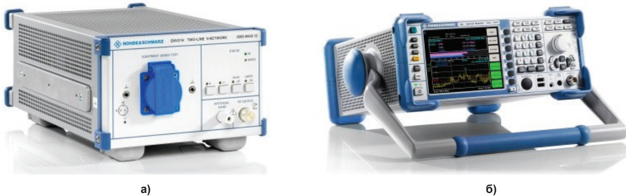
Рис. 1. Эквивалент сети Rohde & Schwarz ENV216 (а) и тестовый приемник Rohde & Schwarz ESL3 (б)