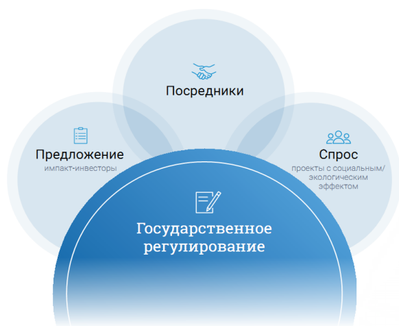
Рис. 3. Экосистема импакт-инвестирования