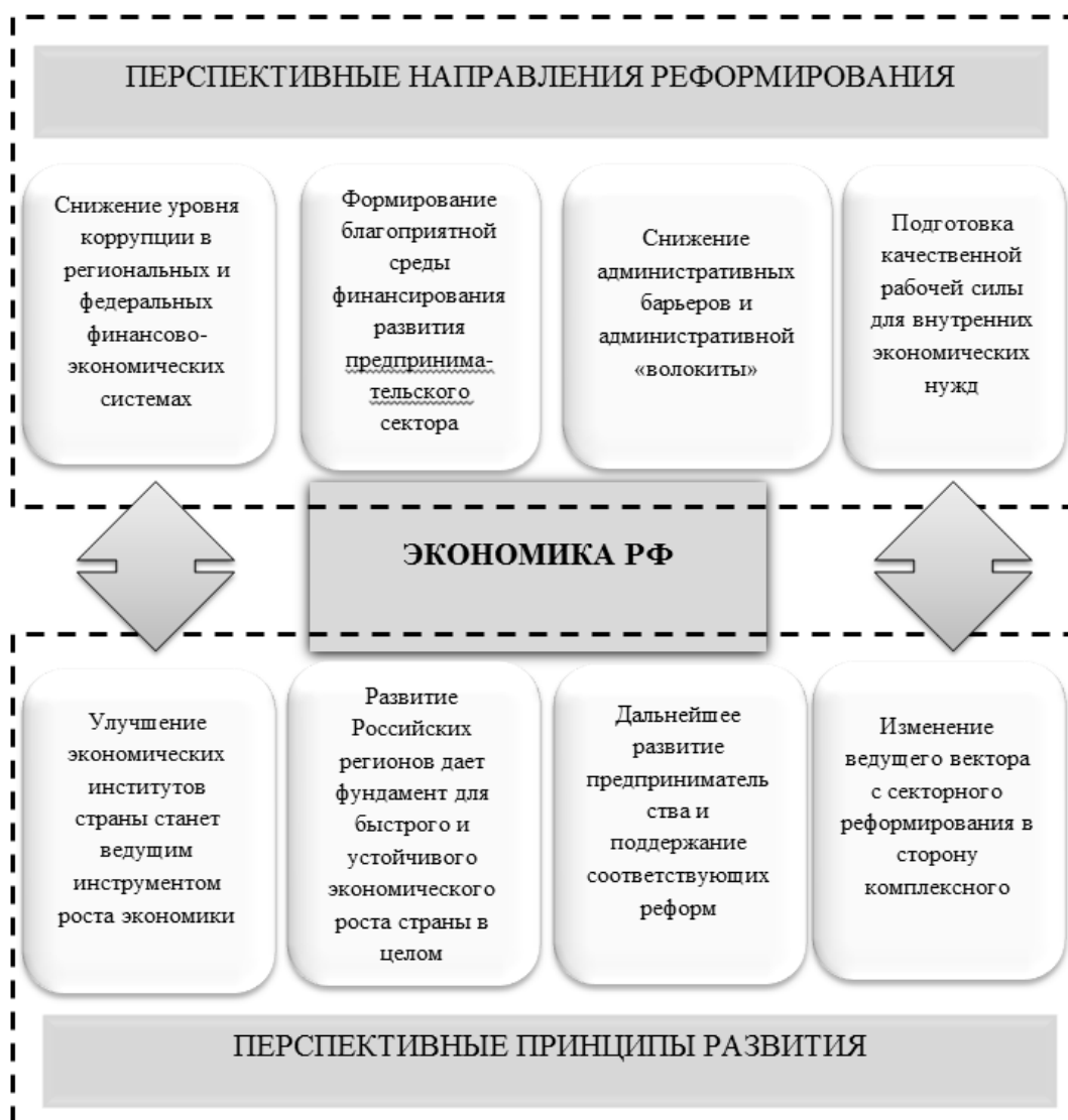
Рис. 1. Перспективные принципы экономического развития и направления экономического реформирования России в ближайшей перспективе. Составлена авторами на основании материалов, представленных на World Economic Forum, 2014

чение общественного воспроизводства на инновационной основе.