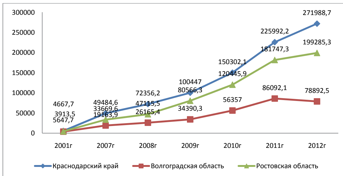
Рис. 4. Задолженность по кредитам юридических лиц (млн руб.)

– остановка производственной деятельности у крупных хозяйствующих субъектов, сокращение рабочих мест;