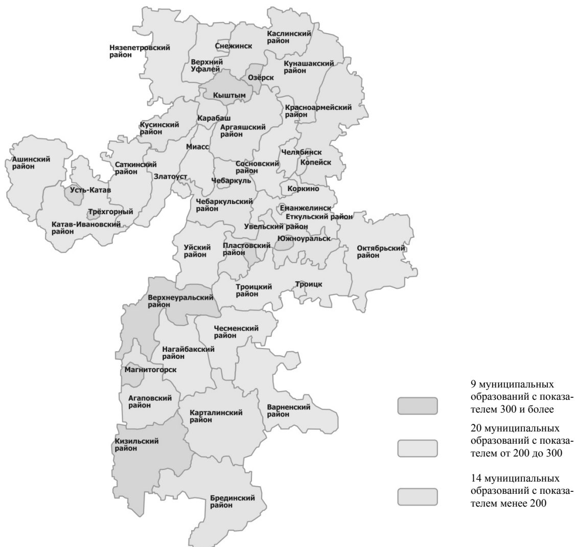
Рис. 1. Плотность субъектов малого и среднего предпринимательства в муниципальных образованиях Челябинской области в расчете на 10 тыс. жителей

Одним из важных вопросов, на наш взгляд, является софинансирование местных бюджетов на реализацию мероприятий по развитию бизнеса в муниципальных образованиях области. В 2013 году субсидии предоставлены 39 муниципалитетам на 75 млн руб. На софинансирование муниципальных программ на развитие предпринимательства было выделено 39 млн руб. По состоянию на 01.12.2013 г. фактически освоено 74,4 % поступивших средств, в муниципалитетах оказана адресная поддержка 138 субъектам малого и среднего предпринимательства.