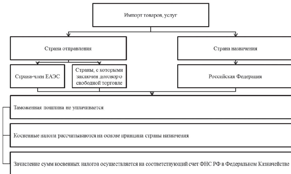
Рис. 2. Особенности исчисления таможенных платежей при импорте товаров на территорию ЕАЭС (страна отправления – член ЕАЭС, либо страна, с которой заключен договор о зоне свободной торговли)

2. Косвенные налоги рассчитываются также, исходя из принципа страны назначения, который предполагает применение ставки 0 % к экспорту товаров и обложение косвенными налогами по законодательству страны назначения.