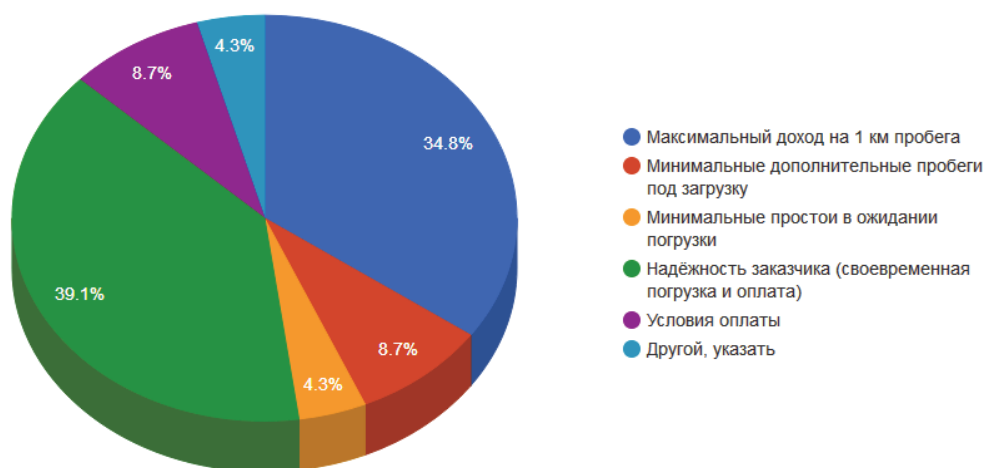
Рис. 4. Распределение предприятий по плановым показателям для менеджеров