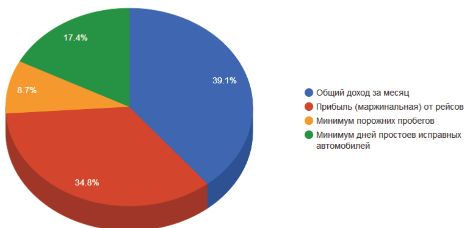
Рис. 3. Распределение предприятий по плановым показателям для менеджеров

Ранее проведённые исследования [4] показали, что наиболее эффективным показателем является маржинальная прибыль, однако для её расчёта необходим более детальный учёт затрат [5].