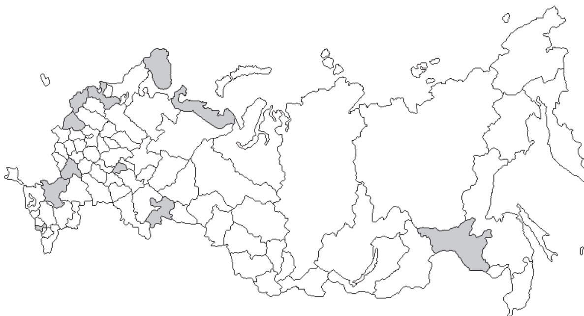
Рис. 1. Регионы, в законодательстве которых административно-территориальное деление отождествляется с муниципально-территориальным