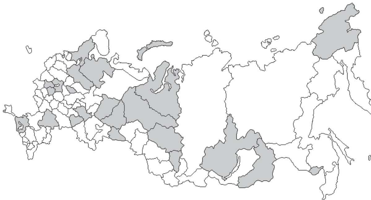
Рис. 5. Регионы, в которых административно-территориальное деление рассматривается как территориальная основа государственной власти

ные критерии – цели и принципы административно-территориального устройства (Республика Татарстан, Ханты-Мансийский автономный округ, Ивановская и Самарская области).