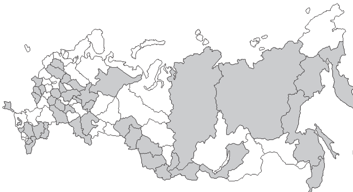
Рис. 3. Регионы, в которых административно-территориальное деление является основой функционирования органов государственной и муниципальной власти