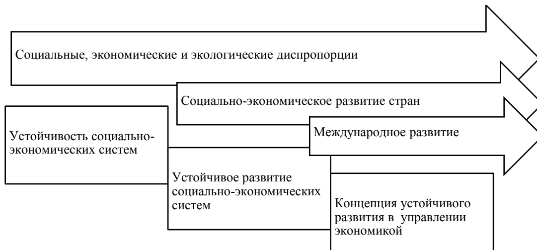
Рис. 1. Эволюция понятий устойчивости социально-экономических систем

смыслу оно противоположно как деградации, застою, устойчивому состоянию, балансированию на грани сохранения и разрушения (выживания), так и неустойчивому развитию – прогрессивному изменению, связанному с периодически повторяющимися кризисами [27–30].