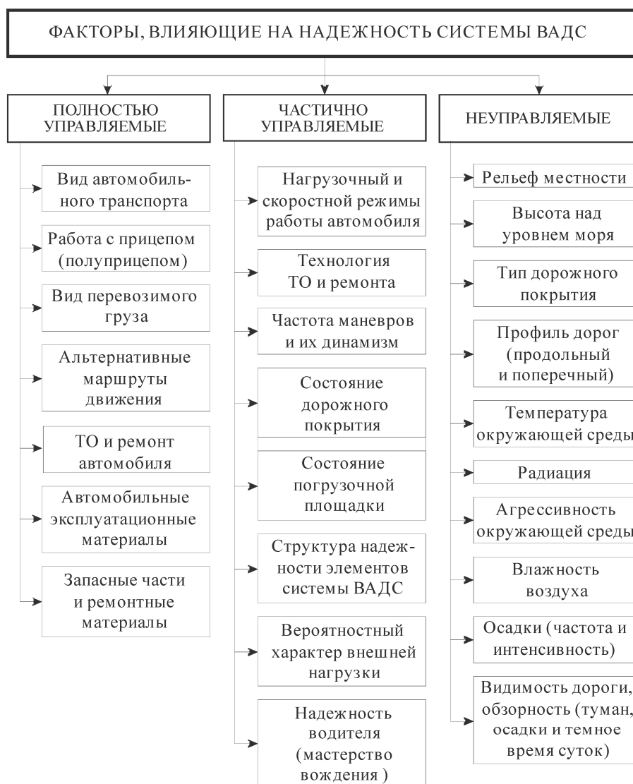
Рис. 2. Классификация факторов, влияющих на надежность системы ВАДС в горных условиях по признаку управляемости

Колебания сил сопротивления автомобиля в процессе выполнения им транспортных работ в горных дорожно-климатических условиях, согласно предложению академика В.Н. Болтинского, можно разделить на две категории [11]: