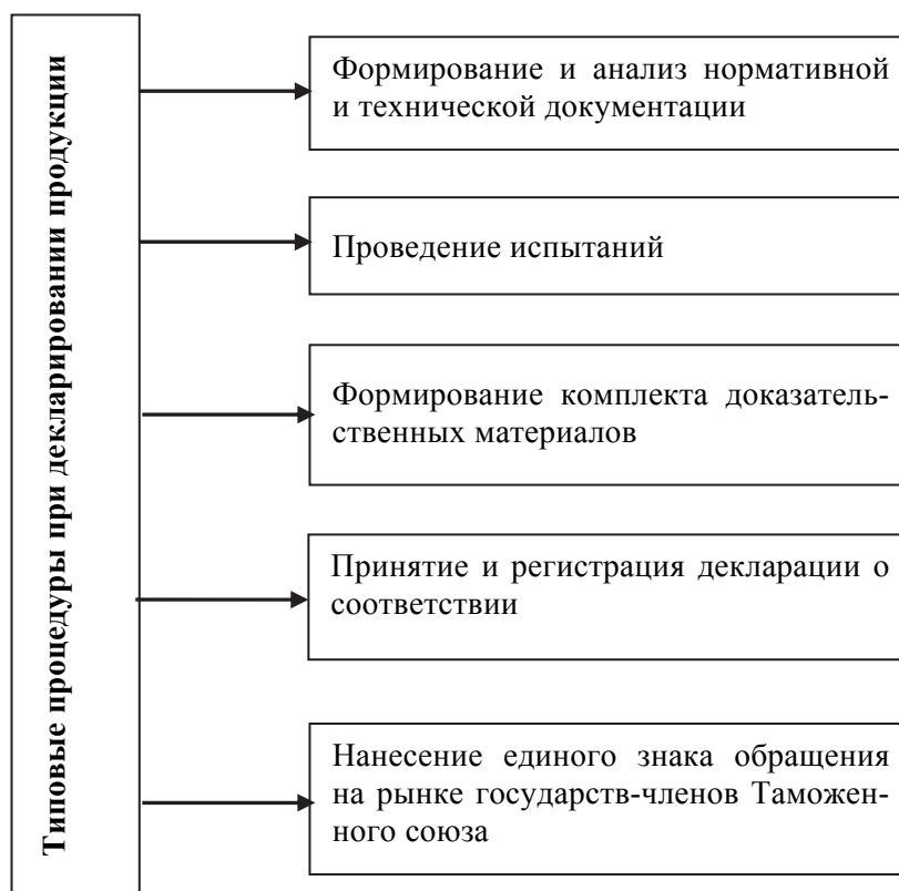
Рис. 2. Основные процедуры при декларировании продукции

Кроме того, каждая партия поставляемого зерна при его выпуске в обращение на единой таможенной территории сопровождается товаросопроводительными документами, которые должны содержать информацию о декларации соответствия партии зерна требованиям настоящего технического регламента.