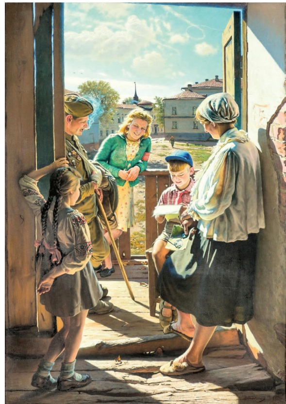
А. Лактионов. Письмо с фронта. 1947. Холст, масло. 225×155 см. Государственная Третьяковская галерея, Москва

Ю. Непринцев, как и А. Лактионов, — представитель Петербургской школы живописи. Оба были учениками И. Бродского, который, в свою очередь, учился у И. Репина. Известно, что Непринцев высоко ценил творчество ключевой фигуры русского реализма: «Репин захватывает своим неповторимым умением предельно выразить через состояния и переживания героев большую мысль, актуальное социальное и философское содержание. И основное в его работах — не эффектный артистичный мазок, не мастеровитость исполнения (при всей своей внешней выразительности они подчас бывают холодными), а большое умное мастерство, подчиненное единой цели: с предельной силой через раскрытие психологического состояния героев выразить основную мысль, идейный замысел» [4, с. 14—16].