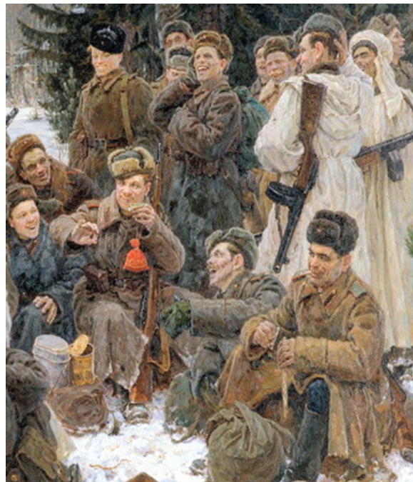
Прим. 1. Фрагменты картин И. Репина «Запорожцы» и Ю. Непринцева «Отдых после боя»