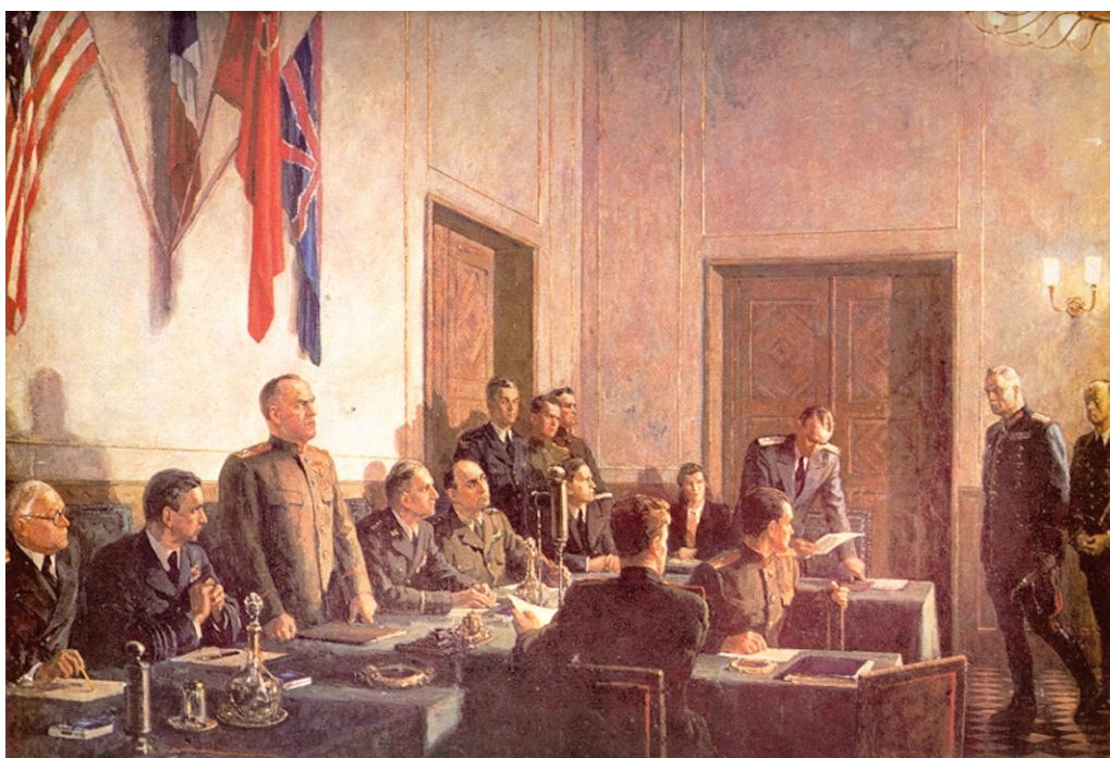
М. Куприянов, П. Крылов и Н. Соколов (Кукрыниксы). Подписание акта о безоговорочной капитуляции Германии. 1945—1946 гг. Холст, масло. 300×400 см. Челябинский государственный музей изобразительных искусств

Во взгляде Жукова, устремленного на врага, отражены благородный гнев, величественность и сила. Этот сын русских крестьян, ставший маршалом, выступает здесь от имени народа-победителя, который принес неисчислимые жертвы на алтарь Победы. Недобрый взгляд Кейтеля, представителя немецкого юнкерства, наполнен холодом, отстраненностью и обреченностью. Он пытается сохранить позу аристократа, играет роль фельдмаршала, но внутренне сломлен и опустошен. Союзники сдержаны и исполнены достоинства, но представлены лицами явно второго плана, доминирует фигура Жукова. Так авторы подчеркнули главенствующую роль СССР в победе над фашистской Германией, олицетворением которой стал герой из народа маршал Жуков. Благодаря типизации образов Жукова и Кейтеля, психологической наполненности их противостояния, авторам удалось избежать того холодного официоза и парадности, идеологической перегруженности, которыми порой грешили работы художников со-