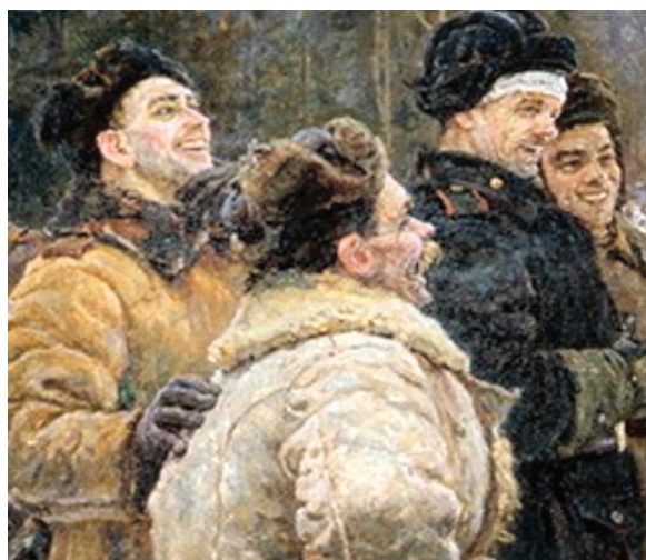
Прим. 3. Фрагменты картин И. Репина «Запорожцы» и Ю. Непринцева «Отдых после боя»

справедливости, народность, типизация образов, оптимизм, конкретность, опора на традиции русской школы живописи, в особенности В. Сурикова и И. Репина. Работы наполнены силой, любовью к своему народу и выполнены с удивительным ху-