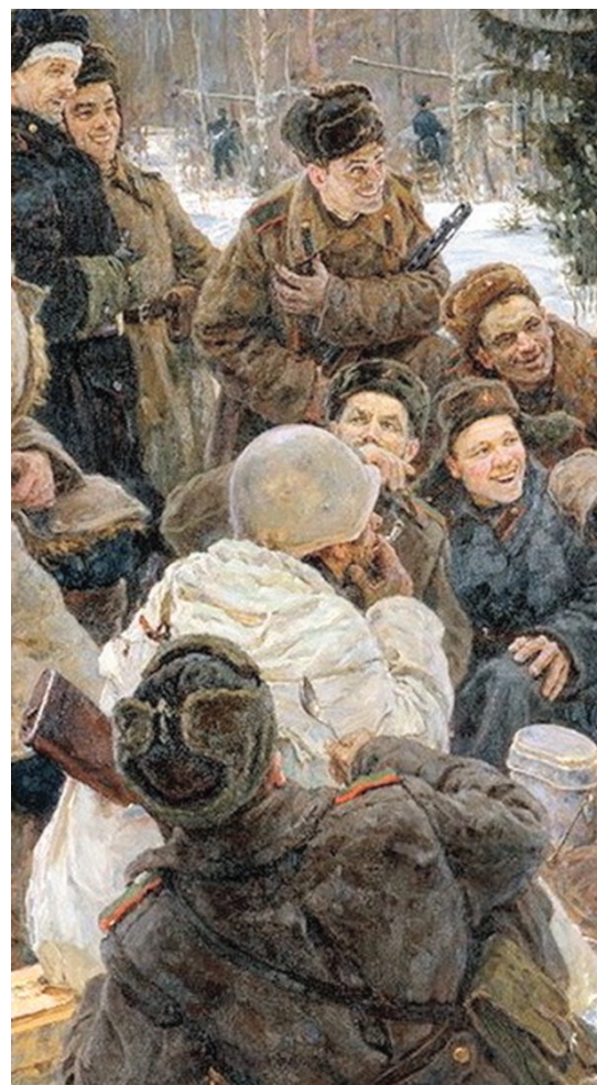
Прим. 2. Фрагменты картин И. Репина «Запорожцы» и Ю. Непринцева «Отдых после боя»