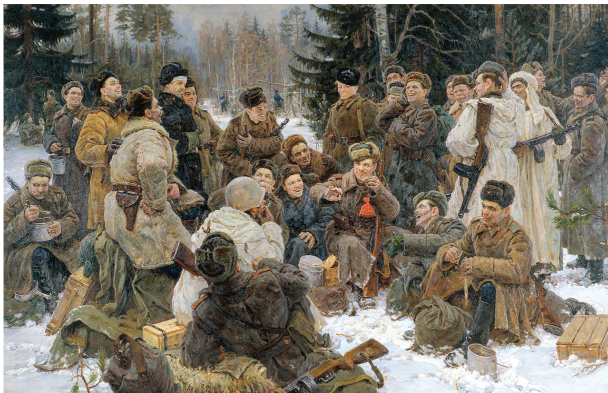
Ю. Непринцев. Отдых после боя. 1951. Холст, масло. 192×300 см. Государственная Третьяковская галерея, Москва

Напряжённая работа автора над картиной продолжалась с 1949 по 1951 г. и увенчалась большим успехом. Показанная на Всесоюзной художественной выставке в Москве, она получила высокую оценку зрителей и специалистов. В 1952 г. за картину