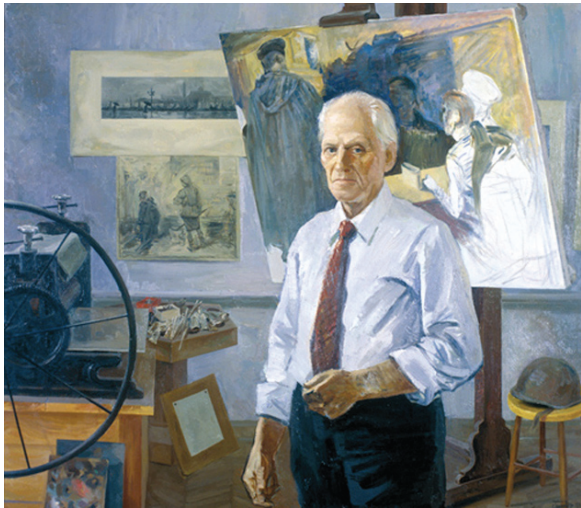
С. Бицираев. Портрет Ю. М. Непринцева

«Отдых после боя» Юрий Непринцев был удостоен Сталинской премии первой степени.