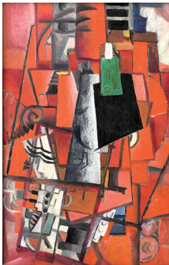
Рис. 1. К. С. Малевич. Дама и рояль. 67×44,5 см / 70×47,5 см

Согласно вышеперечисленным исследованиям стиливое стиливое поле периода написания произведения «Дама и рояль» включает в себя кубизм (1913), футуризм (1912—1913), кубофутуризм (1912—1913), феврализм (1913—1914). Но с изучаемой нами работой возникают определенные сложности. При