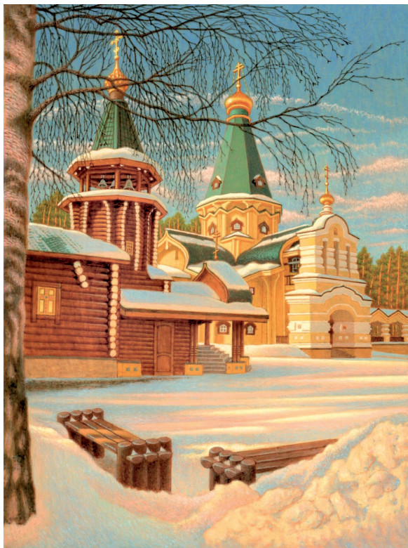
Рис. 8. Мужской монастырь Царственных Стратотерпцев. Ганина Яма. Левкас. Темпера

темперы, где удивительным образом раскрывается панорама с видами монастырей, храмов, уголков среднерусской полосы. «Исполненные в изысканной ювелирной манере (размеры не превышают 20×15), <...> они сочетают в себе внешнюю декоративность и внутреннюю возвышенность, цельность художественного образа и его символическое звучание» [16, с. 74]. Особый интерес представляет серия картин, посвященных монастырю святых Царственных Стратотерпцев на Ганиной Яме, в которой по-особенному передается величие и тишина обители (рис. 8).