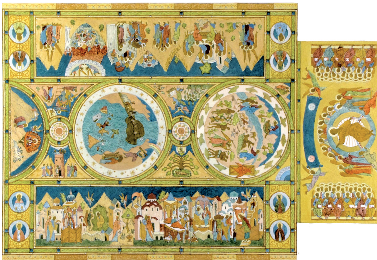
Рис. 5. Форс-эскиз фресковой росписи для Свято-Троицкого кафедрального собора. 2002. Екатеринбург

Если работа по созданию росписи имеет коллективный характер, то рисунок всегда несет авторский почерк. Мастерство рисунка, в котором