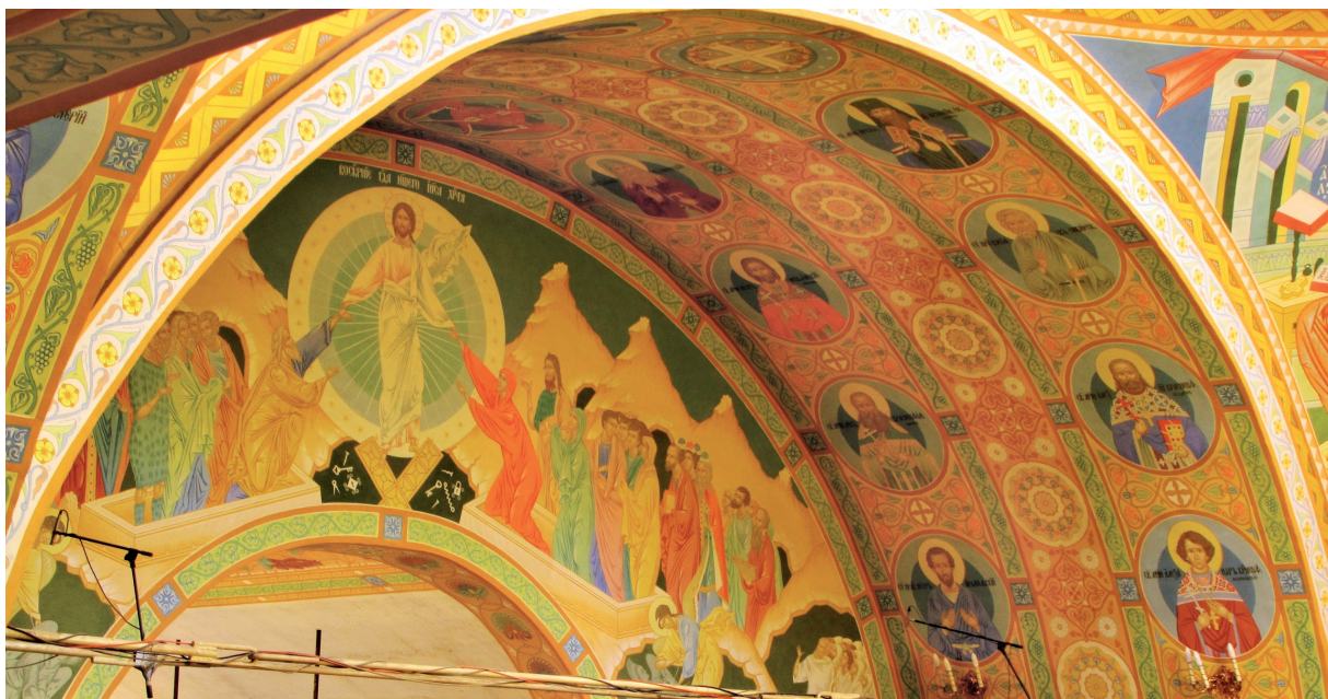
Рис. 6. Западная подпружная арка с избранными уральскими святыми в медальонах. Фресковая роспись. 2006. Свято-Троицкий кафедральный собор. Екатеринбург