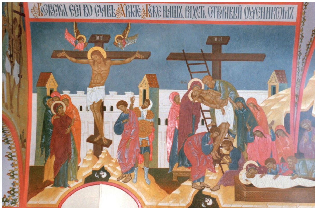
Рис. 1. Сцены Страстей Господних. Роспись стен алтаря верхнего придела. Церковь Вознесения Господня. 1998—1999 гг.

внимания. Эту нишу занимают люди без какой-либо профессиональной подготовки и, чаще всего, не имеющие представления о специфике церковного искусства» 1 . В марте 1999 г. Правление вынесло положительное решение.