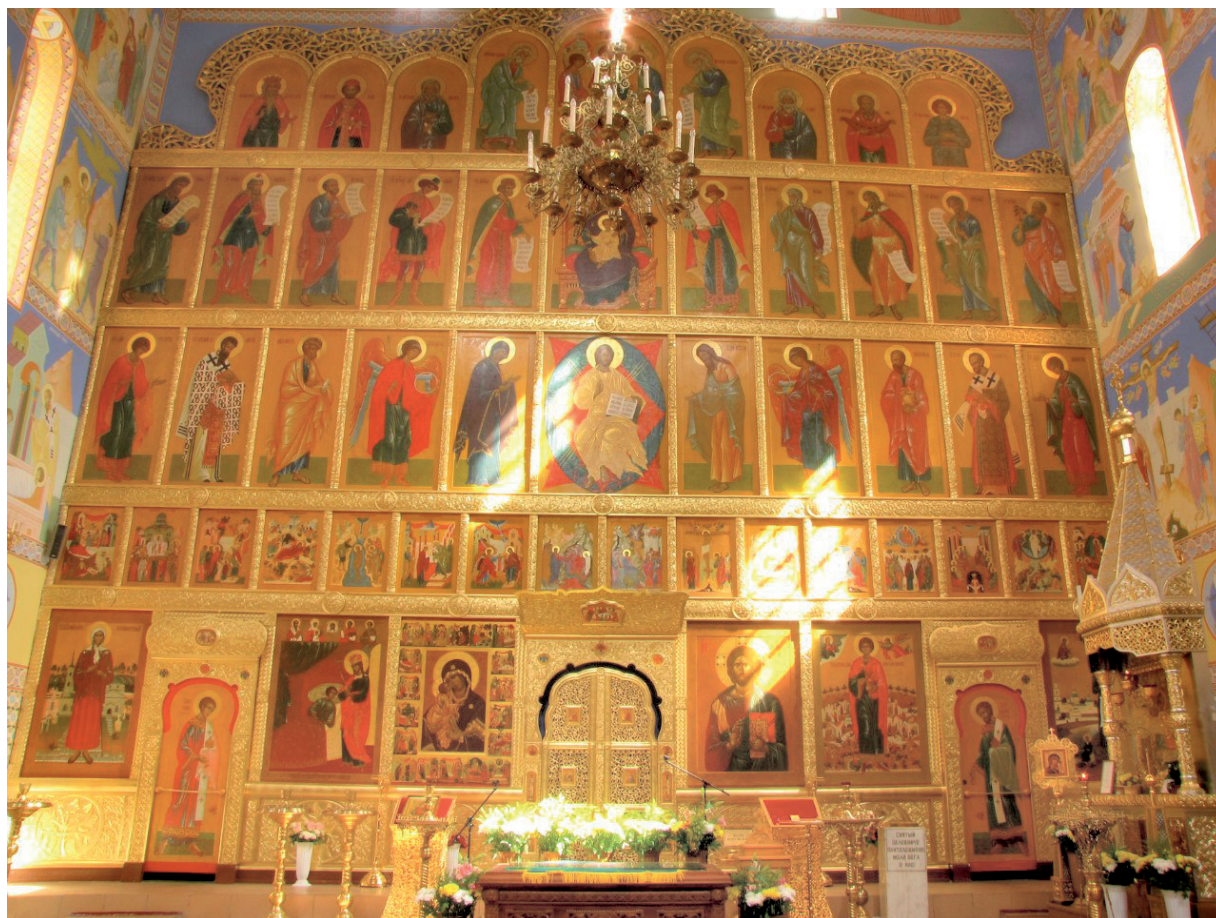
Рис. 3. Иконостас церкви Великомученика и Целителя Пантелеимона. Екатеринбург

арочных проемов, оформлении киотов и на нимбах святых. В отношении орнамента на золотых нимбах художник всегда деликатен, если рассматривать ор-