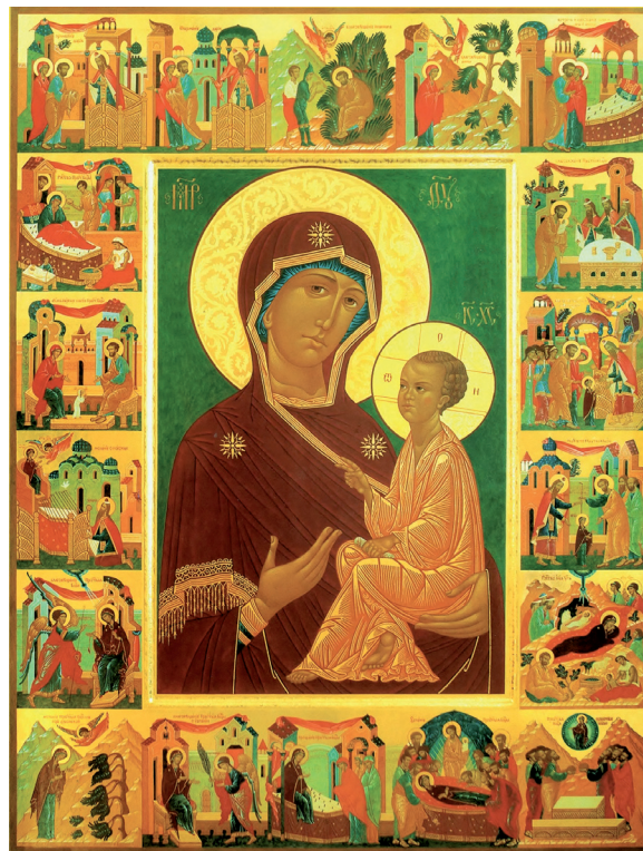
Рис. 2. Икона Божией Матери «Одигитрия». Левкас. Темпера. 1999. Иконостас нижнего придела в честь Рождества Богородицы. Церковь Вознесения Господня. Екатеринбург

был скован в своем творчестве, старался переосмыслить и создать неповторимый орнамент, в том числе и на киотах, созданных в стилевом единстве с иконостасом. Резьба покрыта левкасом, затем поталью