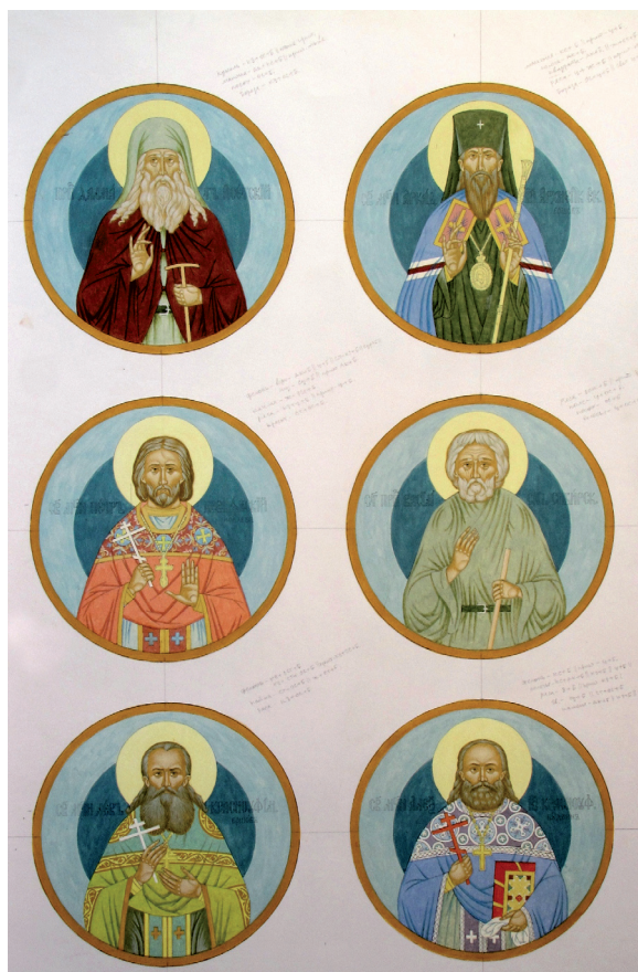
Рис. 7. Образы новомучеников в медальонах. Эскизы для Свято-Троицкого кафедрального собора. 2002. Екатеринбург