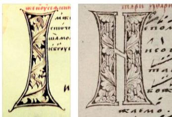
Рис. 1. Буквицы, исполненные Федором Басовым в рукописях «Псалтырь с воследованием и Апостол» [21, л. 42], 1586—1587 гг. и «Стихирарь певческий» 1590-е гг. [30, л. 722]

которые иногда вкрапляются небольшие шишки. Рисунок точный и выверенный. Такие варианты буквиц были созданы и в первопечатных московских книгах.