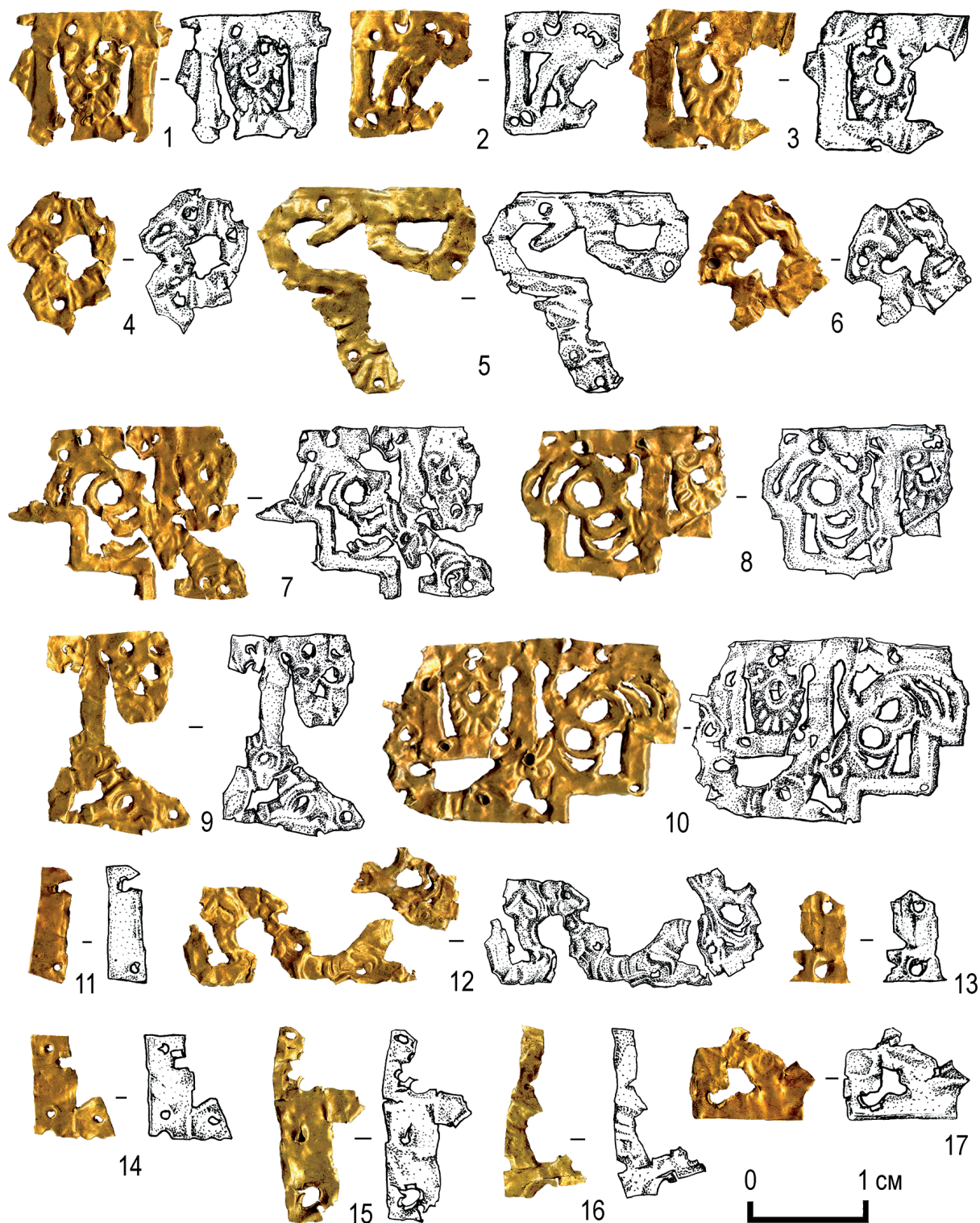
Рис. 2. Фрагменты декоративной пластины, фото и прорисовка (рисунок М. Головиной)

после изготовления предмета. «Рваные» отверстия, нанесенные бессистемно, скорее всего, являются результатом вторичного использования фрагментов изделия.