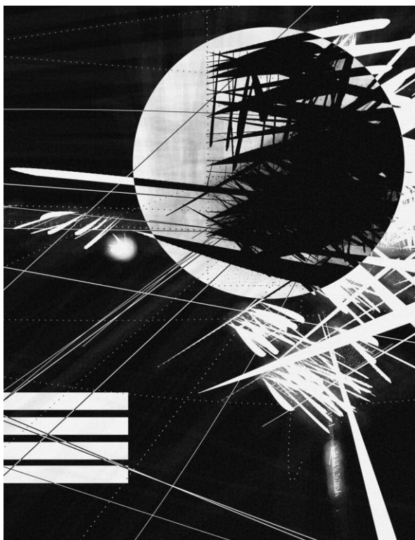
Рис. 4. Дмитрий Черняк «Световые годы», 2022 Fig. 4. Dmitri Cherniak «Light Years», 2022

ставки» в Берлине в 1920 г. [42] «Телефонные картины» не только предвосхищают новые подходы и способы создания произведений искусства, но и показывают, что идейный замысел для современного художника важнее технического исполнения, которое может быть реализовано на фабрике. Таким образом, художник позиционирует себя, как «генератор идей», творец нового типа, для которого замысел важнее, чем его реализация, которую можно перепоручить «ремесленникам». Так, быть может, впервые интеллектуальное и художественное творчество отделяется от производственного процесса.