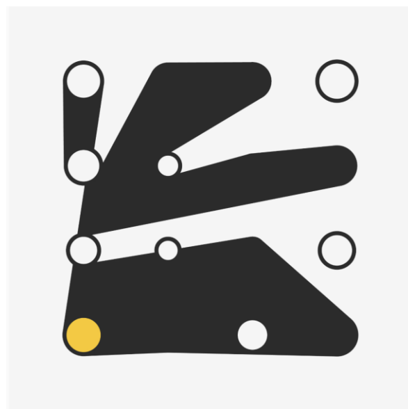
Рис. 3. Дмитрий Черняк «Кольца #910», 2021 Fig. 3. Dmitri Cherniak «Ringers #910», 2021

зовать NFT-технологии еще в 2014 г. Являясь инженером по образованию, он рассматривает свое творчество как часть «автоматизированного процесса», утверждая, что на самом деле «...творчества в этом процессе гораздо больше, чем это принято было считать» [41]. Черняк работает со скриптами, которые позволяют автоматически генерировать изображения на платформе Art Blocks. Он известен своей серией «Ringers», состоящей из 1000 NFTs, в которых используются различные комбинации расположения «струн и колышков», образующих уникальные геометрические композиции (рис. 3).