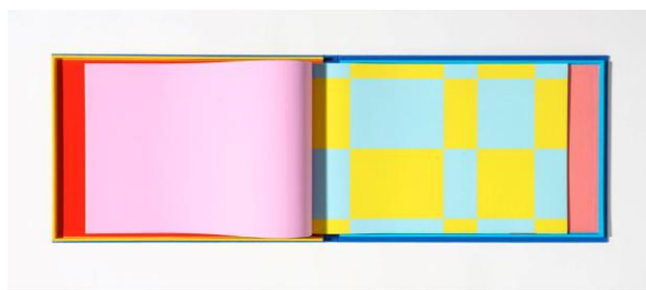
Рис. 5. Рафаэль Розендааль «Один дома», 2020 Fig. 5. Rafaël Rozendaal «HOME ALONE», 2020

Другой представитель этого поколения – Рафаэль Розендааль (Rafaël Rozendaal, род. 1980 г.) – современный художник голландско-бразильского происхождения, пионер и яркий представитель нет-арта (интернет-искусства). Его работы исследуют отношения между цифровым и физическим миром. В центре его внимания оказывается сама плоскость «экран» на которую проецируется изображение, однако эта плоскость осмыслена как метафизическая граница между мирами – реальным и вымышленным [48]. Несмотря на то что Розендааль является одним из самых ярких представителей именно цифрового искусства, он создает также «физические» версии в виде иммерсивных пространственных инсталляций, настенных росписей, холстов и видеоинсталляций, которые отражают эстетические и концептуальные темы его цифровых работ. Современная арт-критика, в лице интернет-издательства Stirworld, анализирует художественный метод автора, отмечая, «...что увлечение веб-сайтами и доменными именами постепенно превратилось в объединение различных материалов и форм для выдвижения аргументов, которые часто пересекают тонкую грань между виртуальным и физическим. Эта дихотомия наряду с вопросами доступности составляет суть политики Розендаля, поскольку он регулярно работает как для интернета, так и для галерей» [49] (рис. 5).