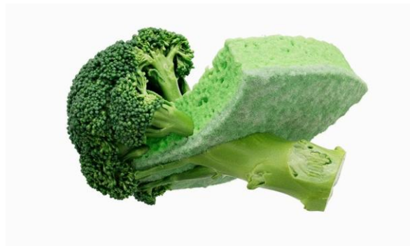
Рис. 6. Урс Фишер «Хаос №21. Буколический», 2021 Fig. 6. Urs Fischer «CHAOS #21 (Bucolic)», 2021

лизмом, намеренно искажая их масштаб. Благодаря этому приему художник меняет фокус зрения, заставляя всякого переосмыслить привычный предметный мир и место создавшего его человека. Таким образом, коллекцию «Хаос» можно рассматривать как исследование концепции реди-мейда в эпоху цифровых технологий, когда эти технологии обеспечивают новый уровень точности и манипулирования повседневными предметами.