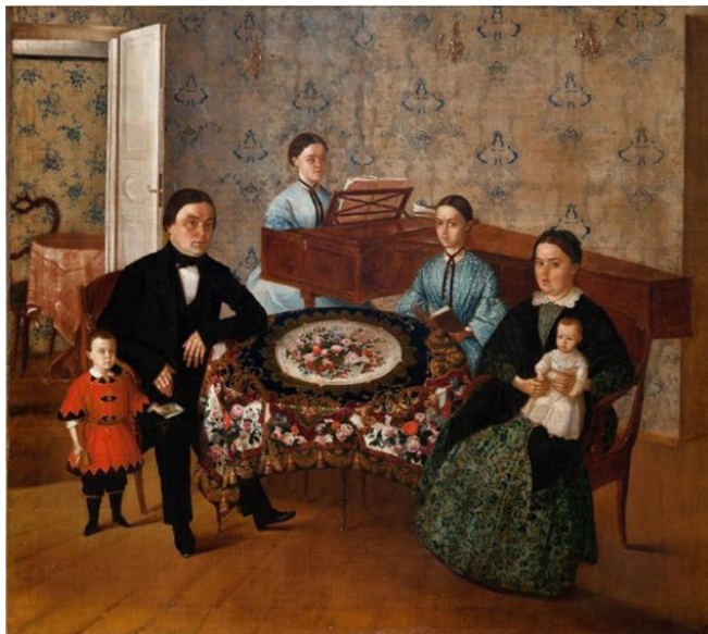
Рис. 10. Г. В. Сорока (1823–1864). Московская семья. 1840-е гг. Холст, масло. 84x95 см. Московская государственная картинная галерея народного художника СССР Ильи Глазунова. Инв. № Ж-553 Fig. 10. G. V. Soroka (1823–1864). A Moscow family. 1840s. Oil on canvas. 84x95 cm. Moscow State Art Gallery of the People's Artist of the USSR Ilya Glazunov. Inv. № Ж-553