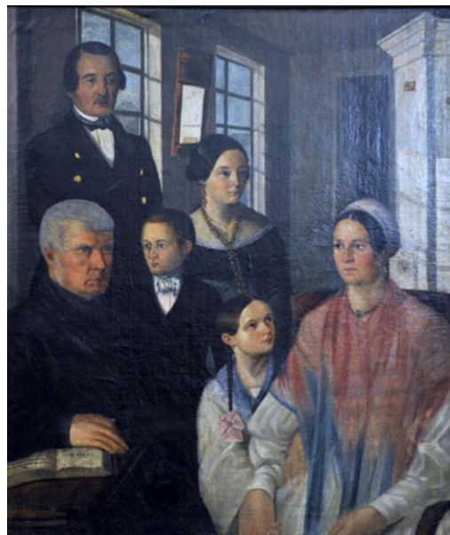
Рис. 11. Неизвестный художник. Семейный портрет. Середина XIX в. Холст, масло. 112x95 см. Нижнетагильский музей-заповедник «Горнозаводской Урал». Номер в Госкаталоге: 40673520