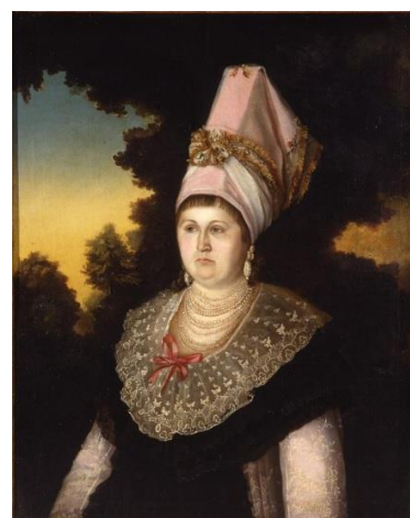
Рис. 4. Неизвестный художник. Портрет сибирской купчихи. 1810-е гг. Холст, масло. 106x85 см. Государственный исторический музей. Инв. № И I 5597 Fig. 4. Unknown artist. Portrait of a Siberian merchant's wife. 1810s. Oil on canvas. 106 x 85 cm. The State Historical Museum. Inv. № И I 5597