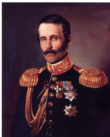
Рис. 12. С. П. Юшков (1821–1860). Портрет С. Г. Строганова. 1850-е гг. Холст, масло. 68x56 см. Государственный Исторический музей. Инв. № И I 1101