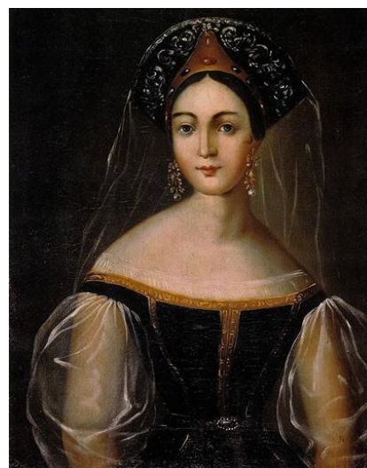
Рис. 13. С. П. Юшков (1821–1860). Портрет Таисии Петровны Серебениковой, дочери ильинского священника. 1850-е гг. Холст, масло. 54x40 см. Пермская государственная художественная галерея. Инв. № Ж-1193