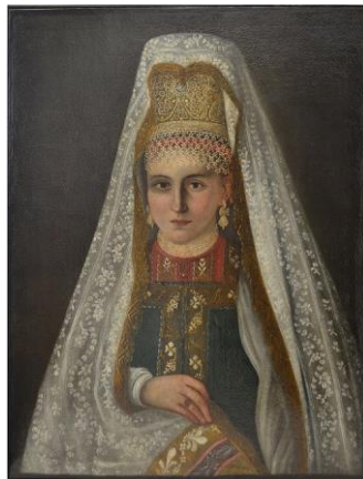
Рис. 1. Неизвестный художник. Портрет женщины в красной рубашке, высоком жемчужном головном уборе и фате. Конец XVIII в. Музей декоративно-прикладного и промышленного искусства РГХПУ им. С. Г. Строганова. Инв. № 1153 Fig. 1. Unknown artist. Portrait of a woman in a red shirt, a high pearl headdress and a veil. The end of the XVIII century. Museum of Decorative, Applied and Industrial Art of the Stroganov University. Inv. № 11