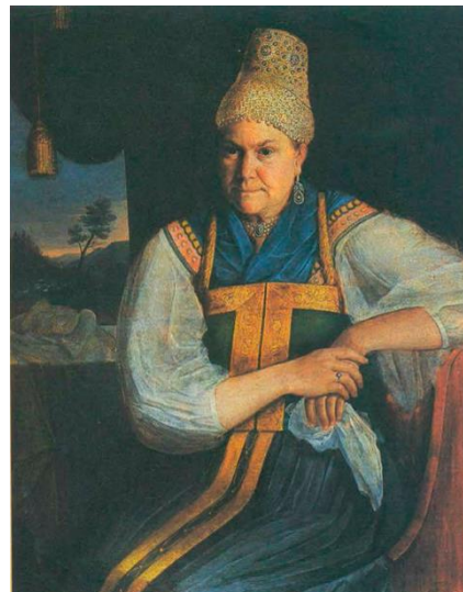
Рис. 7. А. Чижов. Портрет неизвестной купчихи. Первая четверть XIX в. Одесский художественный музей Fig. 7. A. Chizhov. Portrait of an unknown merchant's wife. The first quarter of the XIX century. Odessa Art Museum