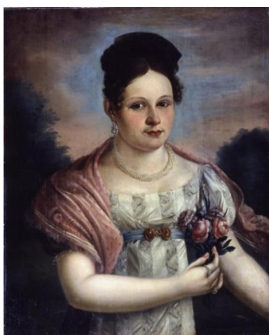
Рис. 3. М. А. Васильев (1784 – после 1839). Портрет Елизаветы Осиповны Басниной, урожденной Портновой. 1821 г. Холст, масло. 75,5x60 см. Государственный исторический музей. Инв. № И I 5594 Fig. 3. M. A. Vasiliev (1784 – after 1839). Portrait of Elizaveta Osipovna Basnina, nee Portnova. 1821. Oil on canvas. 75.5 x 60 cm. The State Historical Museum. Inv. № И I 5594