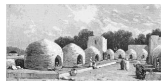
Рис. 2. Медресе в селе Говшут-хана [38, с. 446] Fig. 2. Madrasah in the village of Koushut Khan [38, p. 446]

Яркий образ Говшут-хана нашел отображение в литературном творчестве его современников. Классик туркменской литературы Маметвели Кемине (1770–1840 гг.) с молодости хорошо знал Говшут-хана [15, с. 105]. Героизм Говшут-хана был отображен в рассказе Тёре-бая [5, с. 83] и воспет народным поэтом Кёр-Молла в стихотворении «Аман-Сагат сердар и Кошут-хан хороши!» [1, с. 0127; 4, с. 219–220]. О борьбе текинцев во главе с Говшут-ханом против иранских войск в 1861 г. писал и туркменский поэт Дован-шахир [1, с. 0113]. А. Самойловичем была записана песня в честь Говшут-хана [43, л. 58]. Современником Говшут-хана был представитель туркменской народной сатиры – Нияз-Вели-Кары. В коротких рассказах повествуется, как этот остроумный слепец удачно выходит из сложных ситуаций, в которые его ставят хитрый Говшут-хан и начитанный Тёре-ахун [41, с. 240].