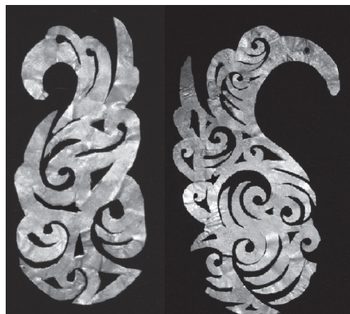
Рис. 1. Ажурные накладки на головной убор (Кичигино I. VII в. до н. э.)

Две золотые нашивки представляют собой стилизованное изображение фигур хищной и водоплавающей птиц. Вся поверхность пластин состоит из трех, четырех ритмических пламенивидных линий, треугольников с загнутым острым верхом. Глаз водоплавающей птицы показан кругом, а у хищной птицы в виде запятой. У хищной птицы за головой есть хохолок, который свидетельствует о том, что на пластине изображен грифон. О том, что перед нами хищная птица говорит, прежде всего, короткий