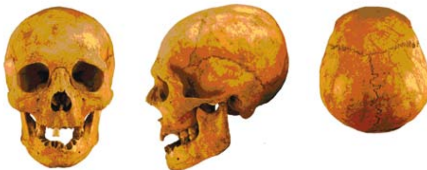
Рис. 3. Череп из кургана 11 погребально-поминального комплекса «Курган 37 воинов». Фото

Сравнение между собой имеющихся черепов тасмолинской археологической культуры показывает относительную неоднородность выборки, смешение как минимум на уровне нескольких поколений европеоидного и монголоидного (или уже смешанного европеоидно-монголоидного) населения. Однако в основе имеющейся серии тасмолинских черепов ядро составляют именно черепа подобного антропологического облика (близкого рассмотренному нами черепу из кургана 11 погребально-поминального комплекса «курган 37 воинов»).