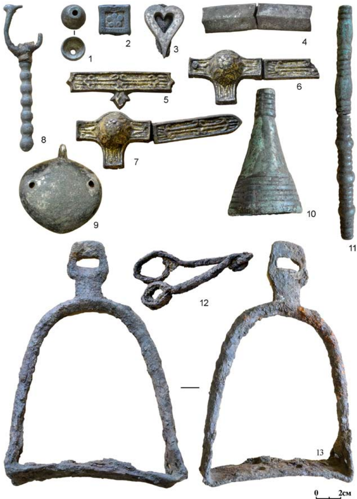
Рис. 3. Могильник Уелги, курган 9, погребение 7. Погребальный инвентарь. 1—4, 8—11 — украшения одежды и пояса; 5—7 — накладные бляшки уздечного набора; 12 — удила; 13 — стремя; 1—11 — бронза, серебро, золотая амальгама; 12, 13 — железо