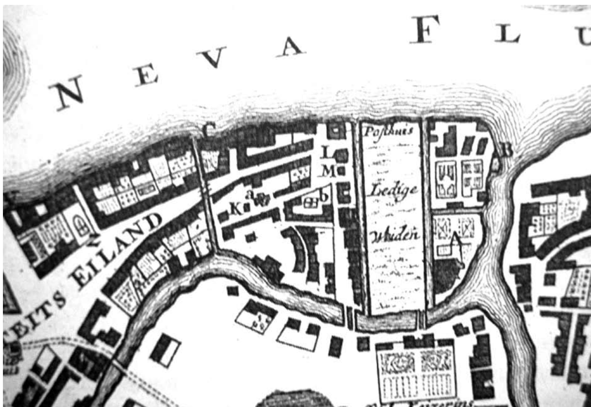
Рис. 2. Фрагмент плана Санкт-Петербурга 1718 г. РНБ

чертеж 1 . На плане Майера хорошо просматриваются здание католической церкви и принадлежавший ей обширный земельный участок. Благодаря ряду ориентиров — Главной аптеке, план которой с Петровских времен почти не изменился, реке Мойке, а также сохранившей свои очертания Миллионной улице (бывшей Немецкой) — путем простого совмещения современной карты (снимка со спутника) равного масштаба с планом Майера легко обнаружить место, когда-то занимаемое церковной постройкой (рис. 3). Очевидно, что храмовая терри-