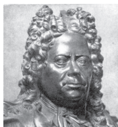
Рис. 5. К.-Б. Растрелли. Автопортрет (предположительно). 1732. Государственная Третьяковская галерея

Русское искусство XVIII в. невозможно представить без творчества еще одного известного петербургского католика — К.-Б. Растрелли (1675—1744), флорентинца по происхождению, ведущего мастера барокко в скульптуре, заложившего целое направление в русской пластике (рис. 5) 71 . Перед приездом в Россию Растрелли в течение ряда лет работал в Риме и Париже, снискал одобрение папы Римского