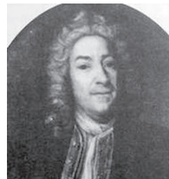
Рис. 2. Неизвестный художник. Портрет неизвестного (Д. Трезини?). 1720-е гг. Гос. Третьяковская галерея

Подаренный ван дер Гаром участок располагался между Мойкой, Царицыным Лугом (Марсовым полем) и Немецкой улицей (Миллионной) — в районе, получившем название Финских шхер из-за большого числа проживавших там финнов. Местоположение костела не было случайным, т.к. вместе с финнами и шведами там же жили галерные мастера-греки, давшие имя Греческой улице и слободе 49 . Галерный флот, таким образом, надо признать колыбелью петербургского католичества. Костел располагался «близ главной аптеки» на месте нынешнего дома № 3 по Аптекарскому переулку 50 . Его можно видеть