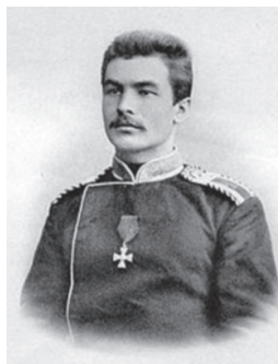
Рис. 2. Петр Кузьмич Козлов (03.10.1863 — 26.09.1935)