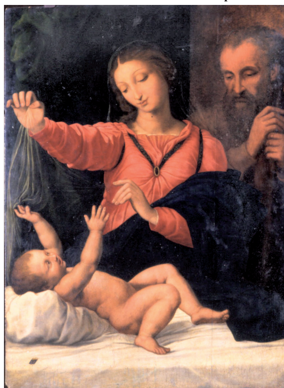
Рис. 2. «Мадонна дель Пополо» Рафаэля Санти. Выставка «Мадонна Рафаэля из Нижнего Тагила» (14.02.12 — 15.03.12)