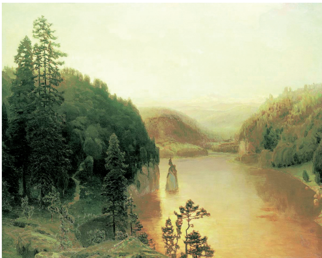
Рис. 3. «Горное озеро на Урале» А. М. Васнецов. Выставка «Картина Аполлинария Васнецова "Горное озеро на Урале"» (16.11.05 — 25.03.06)