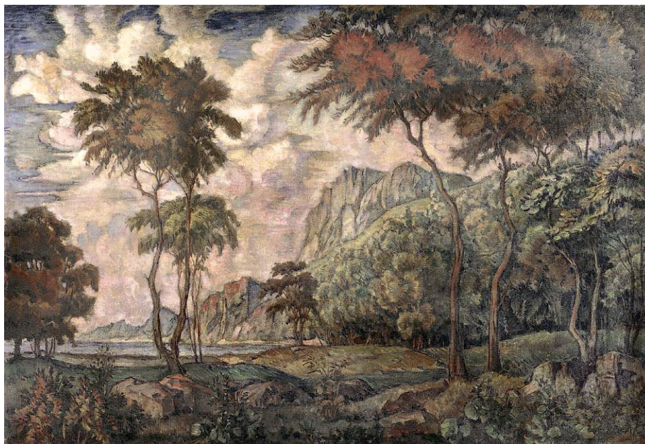
Рис. 7. «Пейзаж с деревьями» К. Ф. Богаевский. Выставка «Шедевры XX века. Отечественная живопись из фондов Челябинской картинной галереи» (08.05.03 — 05.06.03)