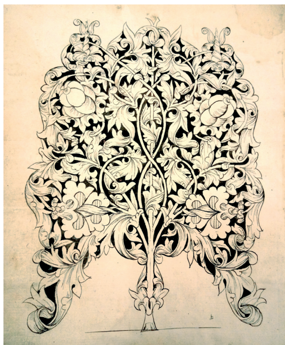
Рис. 3. Федор Басов. Фронтиспис к певческому Стихирарю. Начало XVII в. [2, л. 1 об.]

в ранних выполненных им книжных украшениях, которые, как уже сказано, в целом отчетливо иллюстрирует все этапы развития авторского творчества мастера. Авторские варианты орнаментики Стефана отличаются, прежде всего, структурой: заставка внутри подразделяется на области или геометрические фигуры дугами, стеблями, линиями. Заполнение осуществляется шишками, плодами, плодами-шишками, цветами и др. Среди