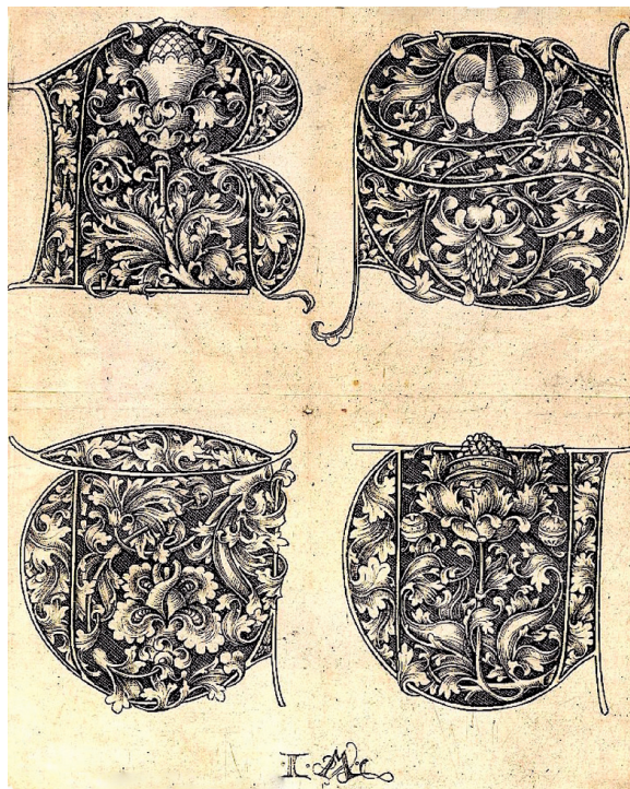
Рис. 2. Израэль ван Меккенем «Большой пописной алфавит», лист 5 (R, S, T, U). Конец XV в.