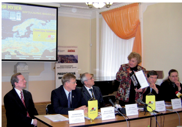
Открытие образовательного центра «Виртуальный филиал Государственного Русского музея». 11 ноября 2005 г.

В функционировании Художественного музея одним из значимых направлений является формирование новых информационных ресурсов для программ обучения, в том числе каталогов экспозиций. Это характеризует музей как современный информационный центр, обладающий методическим обеспечением. В основу данного направления работы легли обучающие материалы образовательного центра «Виртуальный филиал Государственного Русского музея». Это структурное подразделение университетского Художественного музея находится в специально оснащённом зале и насчитывает более ста единиц видеоматериалов и интерактивных программ, разработанных Русским музеем на основе художественных собраний обширного исторического периода с X—XXI вв. Электронный архив включает программы различных направлений, таких как: история русского искусства, музейные коллекции, материалы для изучения и показа экспонатов. Вследствии этого, главной задачей стало создание научно-методических рекомендаций, направленных на систематизацию электронного архива и разработку структуры разделов, исходя из сложности курса и полноты теоретического предмета.