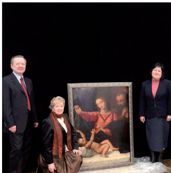
Рафаэль Санти. Святое семейство. 1509 г. Подготовка к экспозиции в Зале искусств ЮУрГУ

Центральное произведение выставки — «Святое семейство», или «Мадонна дель Пополо», приписываемое великому художнику Возрождения Рафаэлю Санти (1509). История этого шедевра связана с именами Римских пап Юлия II и Григория XIV, с римским кардиналом Сфондрато, германским императором Рудольфом II, герцогами Орлеанскими, Наполеоном Бонапартом. В итоге «Мадонна дель Пополо» попала во владение к знаменитым уральским промышленникам Демидовым. По мнению