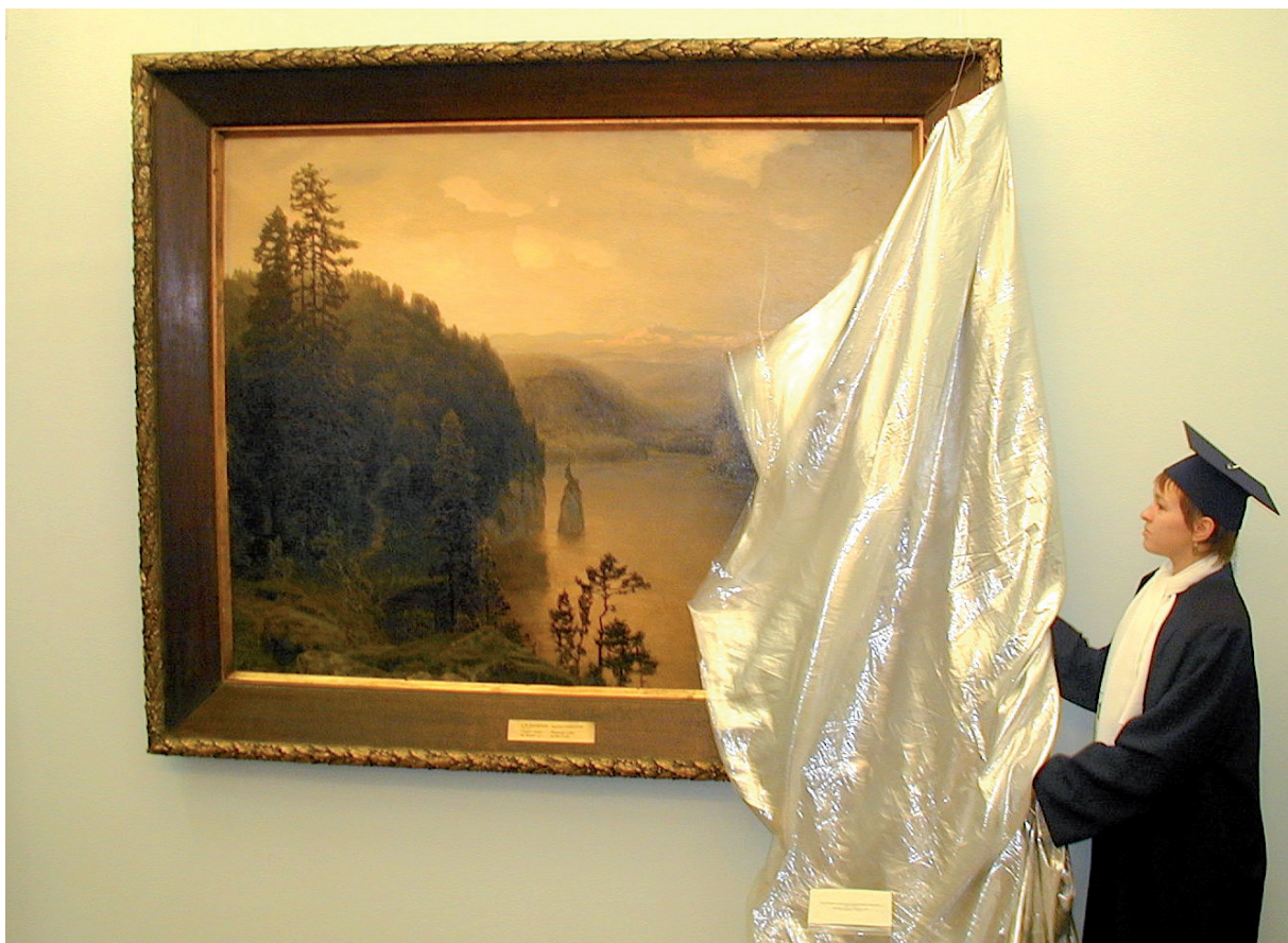
А. Васнецов «Горное озеро на Урале». ГРМ. Открытие выставки в ЮУрГУ

с Челябинским государственным музеем изобразительных искусств. Поэтому, кроме картины Васнецова, экспонировалось еще пять произведений кисти известных русских художников, мастеров XIX — первой четверти XX века: К. В. Лебедева (1852—1916), М. К. Клодта (1832—1902), В. Д. Поленова (1844—1927), В. М. Васнецова (1848—1926) и С. Ю. Жуковского (1873—1944) из фонда Челябинского музея изобразительных искусств. Знакомство студенчества с пейзажем, написанным рукой выдающегося живописца А. М. Васнецова, соприкосновение с образцами живописи других крупных мастеров русской живописи XIX—XX веков, способствовало формированию образного представления о культурных традициях своей страны.