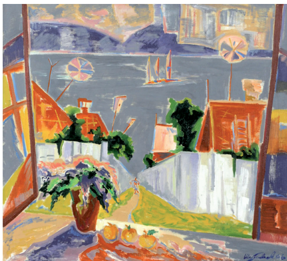
В. Г. Шаповалов. «У озера Тургойак». 2006. Холст, масло. 91,0 × 99,6. Картина подарена автором Залу искусств в 2009 г.

Особо в этом контексте следует выделить выставку живописи В. Шаповалова (08.09.2009 — 20.09.2009). Девятнадцать работ, исполненных в особой авторской манере и запечатлевших пейзажи Южного Урала, были подарены художником в собрание университетского музея. Этот поступок, демонстрирующий высокую духовность и гражданственность автора, является особой страницей истории Зала искусств.