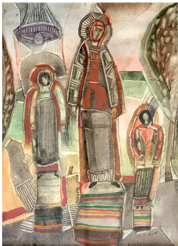
З. Латфулин. Мои персонажи. Бумага, акварель. 23×18. 2000 г.

Знакомство студенческой молодежи с подлинными образцами высокого искусства, в том числе с шедеврами мирового значения, открывает студентам возможность почувствовать себя сопричастными мировым ценностям художественной культуры. То, что эти бесценные коллекции собирались силами уральских промышленников, жителей Урала, родного Челябинска, по-новому раскрывает мир региональной культуры. Интерактивное взаимодействие студентов при восприятии художественных