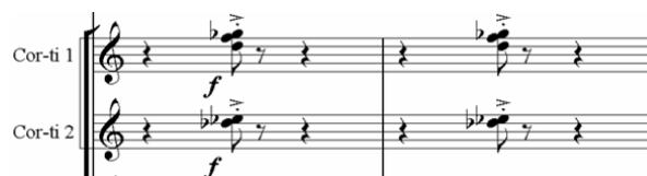
Рис. 4. А. Павлючук «Парадокс», такты 13–14 Fig. 4. A. Pavlyuchuk “Paradox”, bars 13–14

пах. В последующем развитии, постепенно накапливая энергию, как и все произведение в целом, данные созвучия приобретают масштаб общего оркестрового tutti , в вертикали которого присутствуют все 12 полутонов октавы. Такое акустическое решение звучит остро и в достаточной степени «новаторски» по отношению к существующему репертуару духового оркестра. В своей статье М. Анисеева по данному поводу отмечает следующее: «Соноризм представляет собой одну из важнейших техник XX века, в которой выразилось новое мышление и заложен фундамент для последующих открытий в области фактуры и тембра» [16, с. 28].