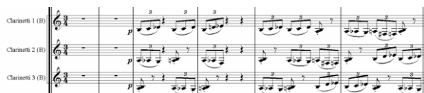
Рис. 2. А. Павлючук «Парадокс», такты 1–6 Fig. 2. A. Pavlyuchuk “Paradox”, bars 1–6

Наряду с особенностями трактовки ударных инструментов интересно проанализировать применения деревянной группы духового оркестра. В начальных тактах произведения характерно использование кларнетов и саксофонов. Партии инструментов группируются в основном попарно, причем движение одного противоположно движению второго. То есть применяется некоторая «инверсионность» в мелодическом расположении, что создает интересный в акустическом плане звуковой эффект (рис. 2).