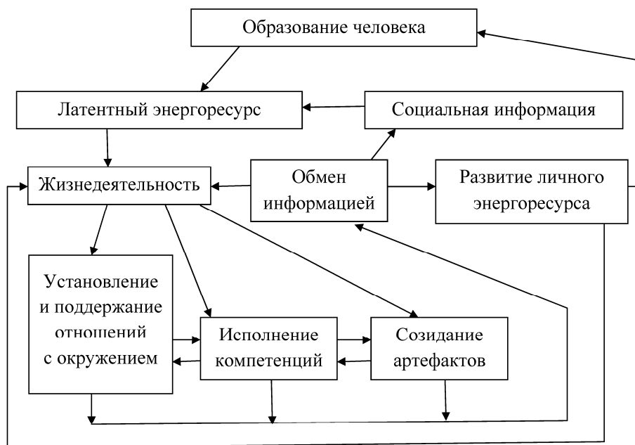
Рис. 2. Образование человека как природоопределенное и социально обусловленное явление

готовностью исполнять определенные компетенции во взаимоотношениях с собой и с окружением. По отношению же к окружению образование человека может способствовать решению актуальных социальных задач (рис. 2). Каждый образованный человек вносит, тем самым, вклад в общий «котел» человеческого энергоресурса.