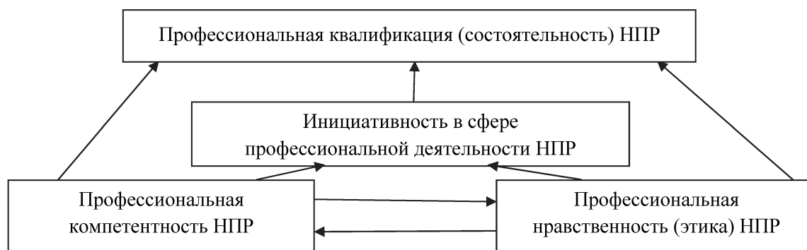
Рис. 2. Структура квалификационных характеристик НПП, разработанная Г.Н. Сериковым [19]

• Теоретические знания по вопросам межкультурного общения и их грамотного применения на практике. Знания, умения и способности справляться с различного рода проблемами, связанными с межкультурным общением. В рамках этой компетенции преподаватель должен иметь хорошее представление о национально-психологических особенностях студентов. Знание этих особенностей