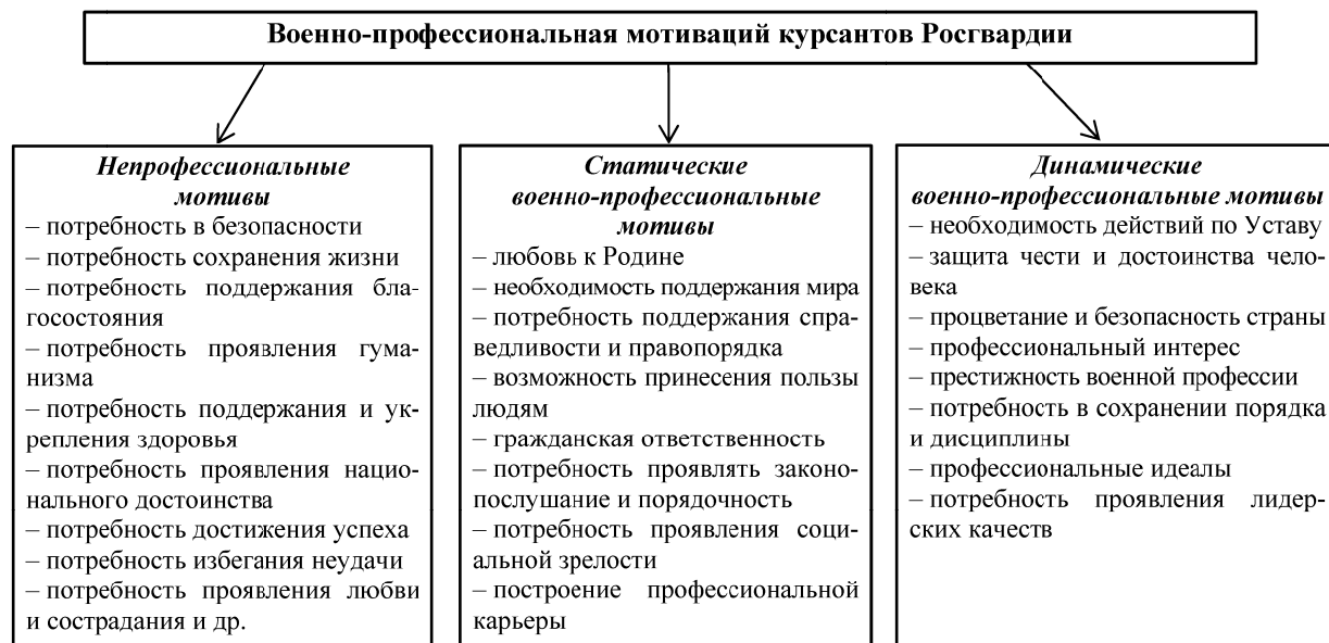
Рис. 2. Классификация военно-профессиональных и непрофессиональных мотивов курсантов вузов Росгвардии