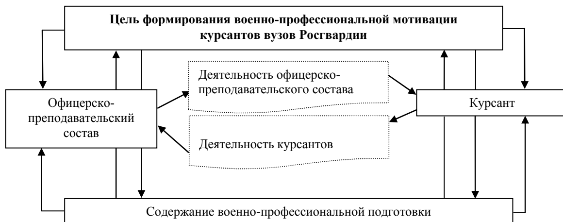
Рис. 4. Взаимосвязь цели и содержания деятельности по формированию военно-профессиональной мотивации курсантов вузов Росгвардии

дии деятельностный подход «исходит из представления о единстве личности с деятельностью, проявляется в многообразии форм деятельности, которые осуществляются с целью изменения в структуре личности» [1, с. 53].