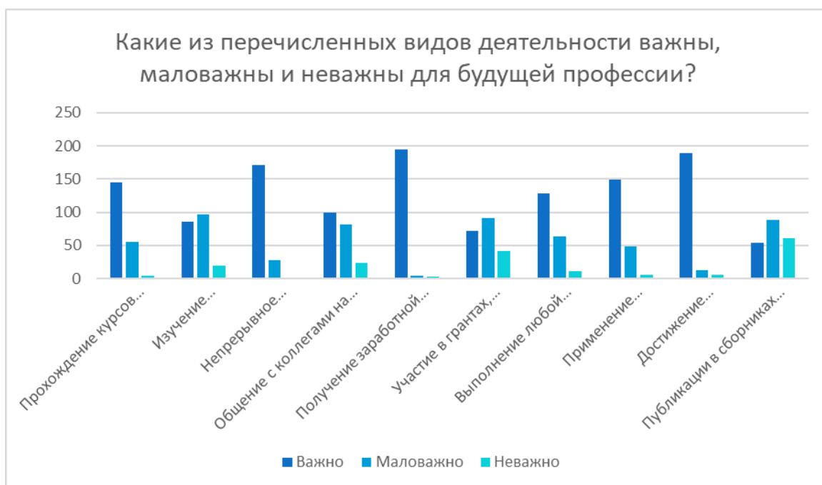
Рис. 2. Результаты анкетирования

важны для будущих специалистов в профессиональной деятельности. Полученные результаты показаны на рис. 2.