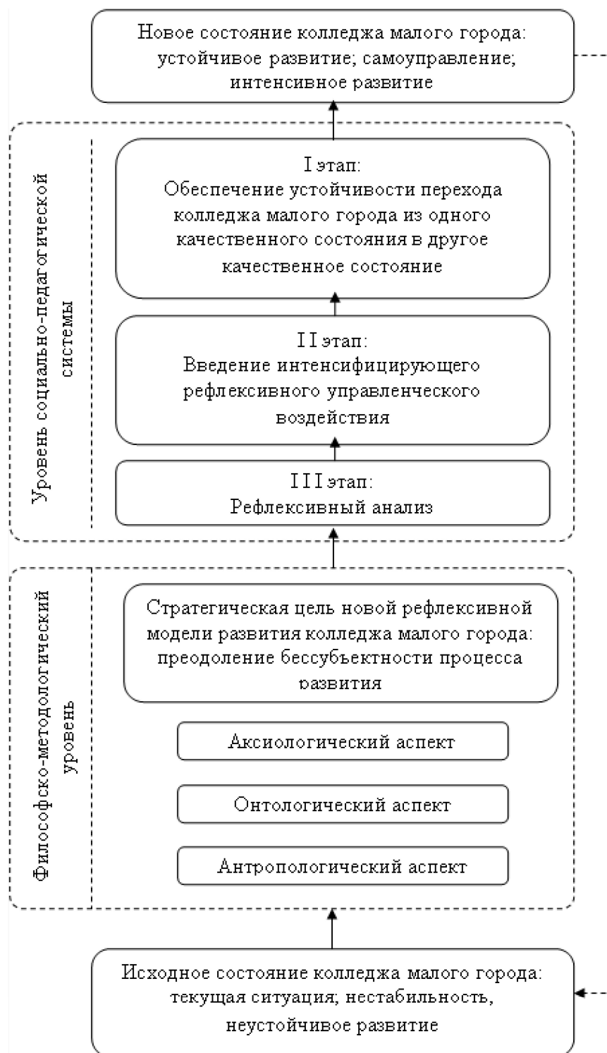
Рис. 1. Обобщенная оптимизационная модель процесса развития колледжа малого города (в контексте рефлексивного управления этим процессом)

М.К. Мамардашвили, характеризуя социально-педагогические системы с рефлексией, пишет, что они «содержат в себе свои же отражения в качестве необходимого элемента (или, иначе говоря, включают в себя сознание наблюдателя в качестве внутреннего элемента