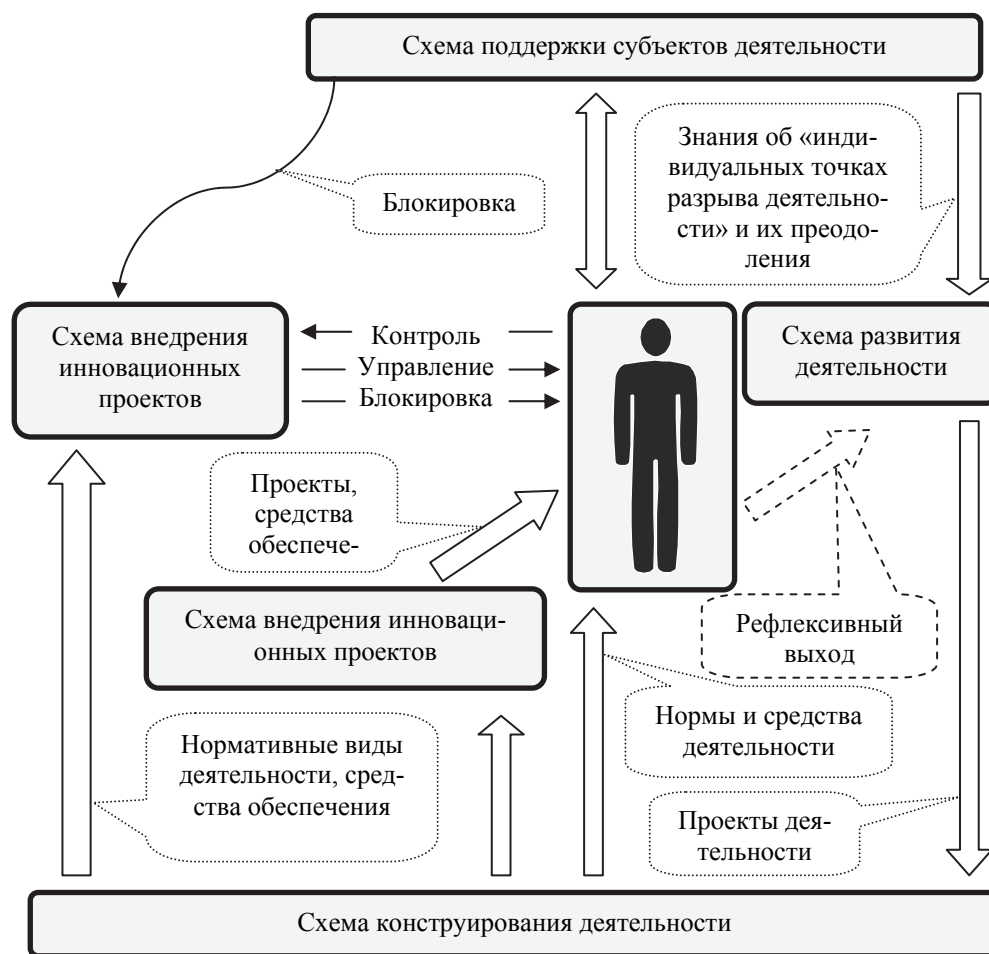
Рис. 3. Модель организации совместной деятельности субъектов развития колледжа малого города в процессе рефлексивного управления