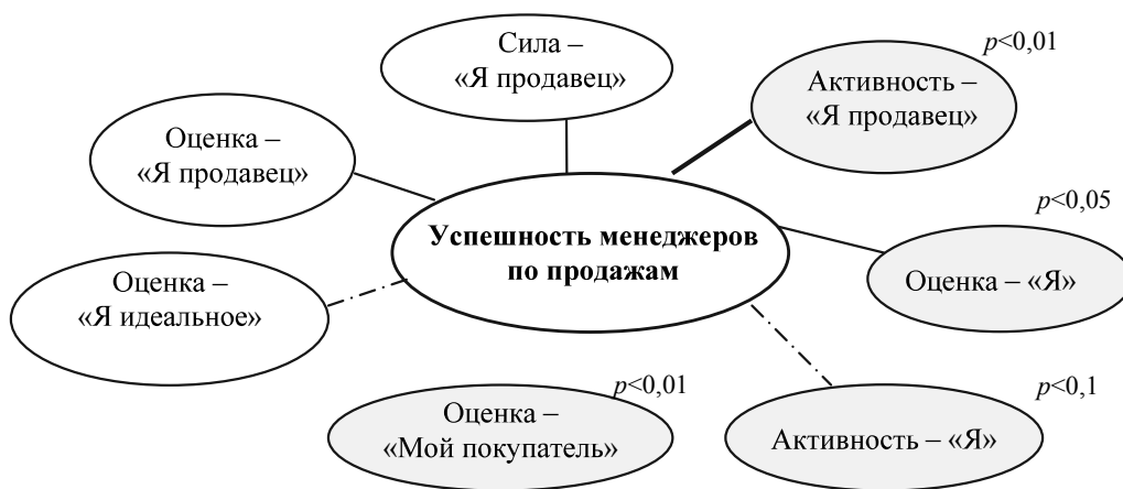
Рис. 1. Взаимосвязь успешности профессиональной деятельности МПП с ролевыми особенностями (личный дифференциал):

– В разности между значениями оценок определяемых ролей «Я продавец» и «Мой покупатель» по фактору «оценка». В результа-