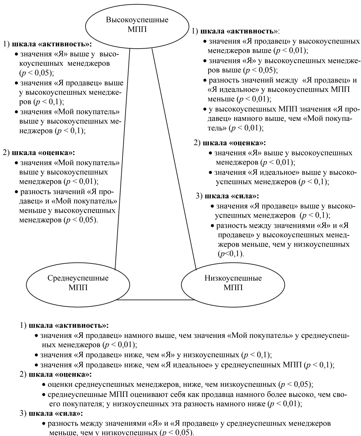
Рис. 4. Различия ролевых особенностей между группами менеджеров с разной успешностью по t -критерию Стьюдента

Таким образом, изучение ролевой составляющей профессиональной деятельности МПП и ее взаимосвязи с уровнем профессиональной успешности позволило установить