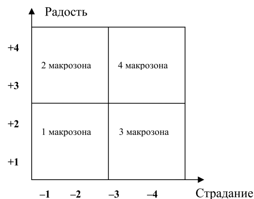
Рис. 1. Макрозоны параметра «Рефлексия эмоциональных переживаний субъекта»: 1 макрозона – макрозона параметрических минимумов; 2 макрозона – макрозона доминирования положительного полюса; 3 макрозона – макрозона доминирования отрицательного полюса; 4 макрозона – макрозона параметрических максимумов

У респондентов с амбиэквальным типом переживания выявляется преобладание образов Я во всех макрозонах (рис. 2).