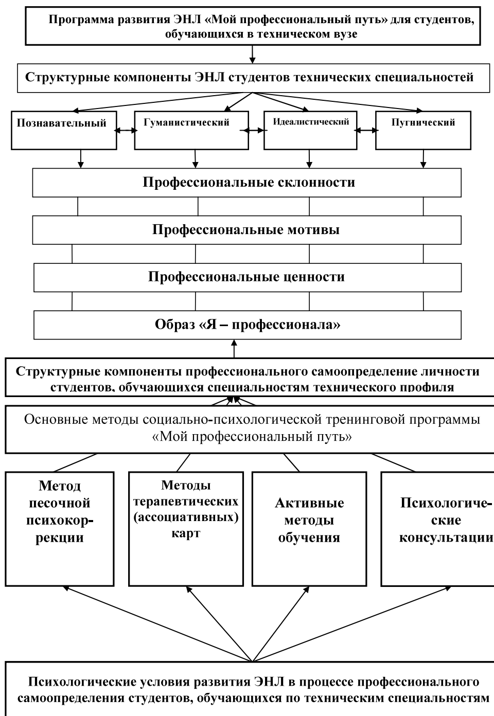
Рис. 2. Модель развития ЭНЛ студентов, обучающихся по техническим специальностям, в процессе применения программы «Мой профессиональный путь» в целях развития их профессионального самоопределения

Результаты формирующего эксперимента позволяют констатировать важность проведения целенаправленных психологических мероприятий по формированию психологических конструктов профессионального самоопределения на этапе обучения в вузе на основе целенаправленного психолого-педагогического вмешательства по развитию ЭНЛ. Результаты применения разработанной автор-