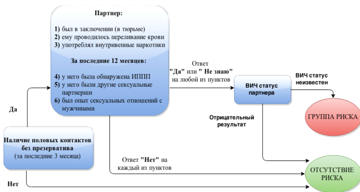
Рис. 1. Алгоритм распределения респонденток по группам

Статистически значимых различий распределения уровневых показателей самооценки риска заражения ВИЧ за последний год в группах не обнаружено ( p > 0,1 ), причем большинство в обеих группах составили женщины с незначительным уровнем риска либо отсутствием такового. Лишь только 7 женщин из 29 представительниц группы риска оценивают