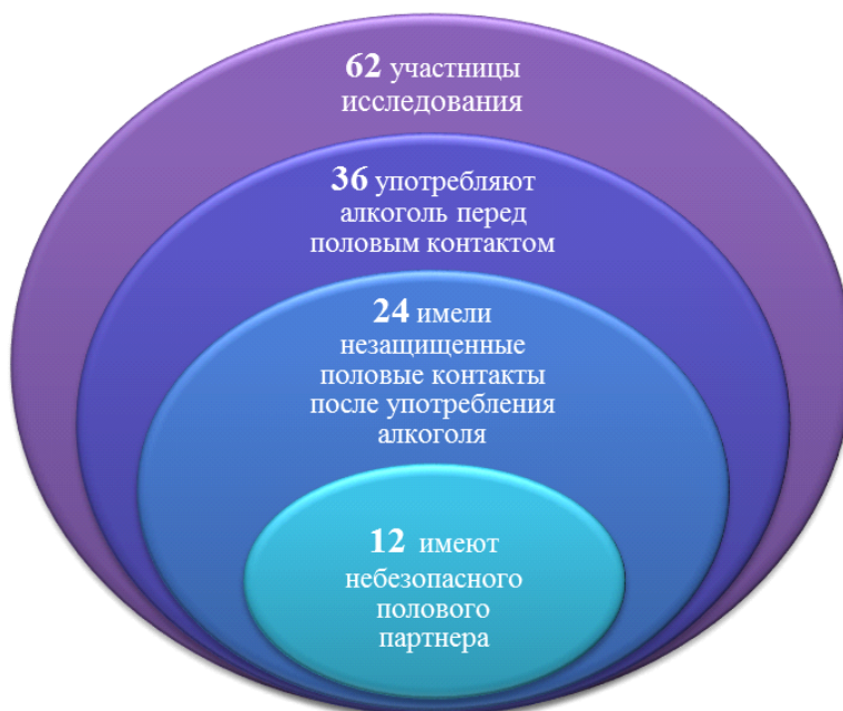
Рис. 2. Алгоритм процедуры выделения подгруппы участниц, имеющих незащищенные половые контакты с основным небезопасным сексуальным партнером на фоне употребления алкоголя

Статус своего основного сексуального партнера такие респондентки определяют как «друг, молодой человек» (6 из 12) или «муж» (4 из 12). При этом все 12 участниц находятся