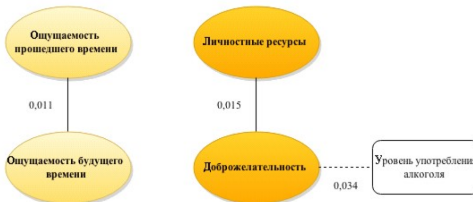
Рис. 4. Структура взаимодействия измеряемых показателей в группе с отсутствием риска ВИЧ-инфицирования